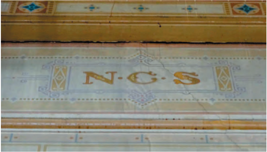
Stationsgebouw, de 1e klas wachtkamer.

Het doel van het project is dat het stationsgebouw uiteindelijk weer open gaat voor publiek.