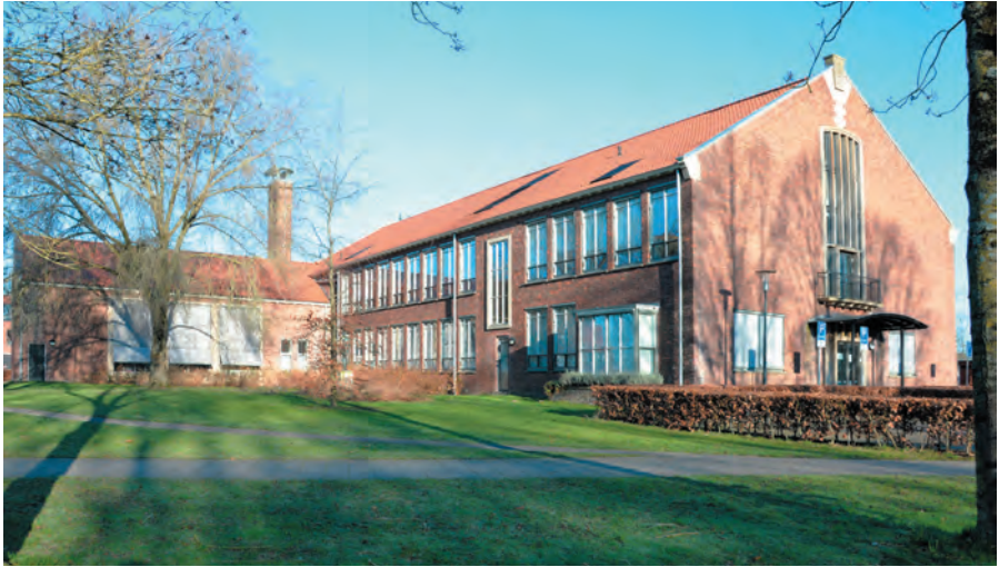
Gezondheidscentrum aan de Oostzeestraat 30-50 Kampen (2022).

chitectuur van architect prof. N. Lansdorp. Het heeft een hoge cultuurhistorische waarde als een van de weinige relictten van de Hanzewijk en als voorbeeld van de scholenbouw uit de jaren vijftig. Het schoolgebouw is ondanks latere wijzigingen vrij gaaf gebleven. Met name de uitstraling van het exterieur is nog vrijwel intact. In Kampen is zo'n monumentaal schoolgebouw uit de wederopbouwperiode zeer zeldzaam. Met de nieuwe functie als Gezondheidscentrum De Hanze is het gebouw weer teruggegeven aan de samenleving. We koesteren dit gebouw en willen het bewaren voor de toekomst.