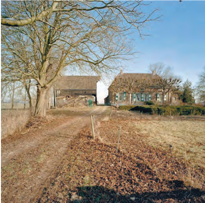
Oosterholtseweg 44 IJsselmuiden. Foto: Rijksdienst voor het Cultureel Erfgoed, documentnummer 324578.

Nadat de nieuwe regels vastgesteld waren kwamen er veel aanvragen voor een Omgevingsvergunning binnen. De gemeente Kampen voorziet dus echt in een behoefte van bewoners. Het nieuws werd opgepikt bij diverse lokale en regionale kranten en kwam zelfs op landelijke televisie.