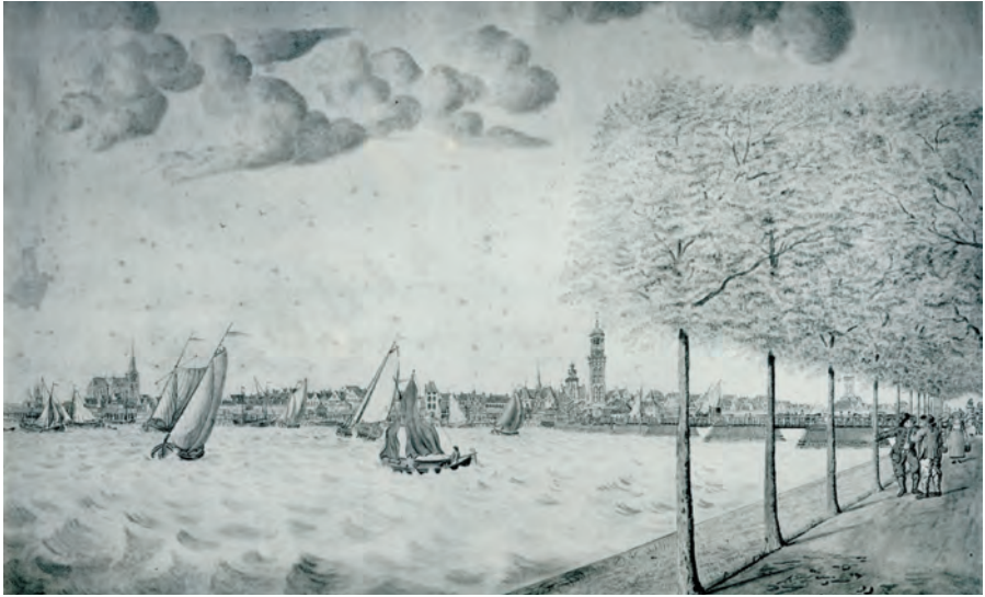
Kampen met de oude IJsselbrug, tekening door Pieter Remmers (1744-na 1810). Collectie SNS Historisch Centrum.

ook zijn erfgenamen, want de borgstelling moet niet voor slechts zes jaar gelden, maar voor altijd. Bovendien moeten niet alleen de personen garant staan, ook de goederen moeten dienen als zekerheid.