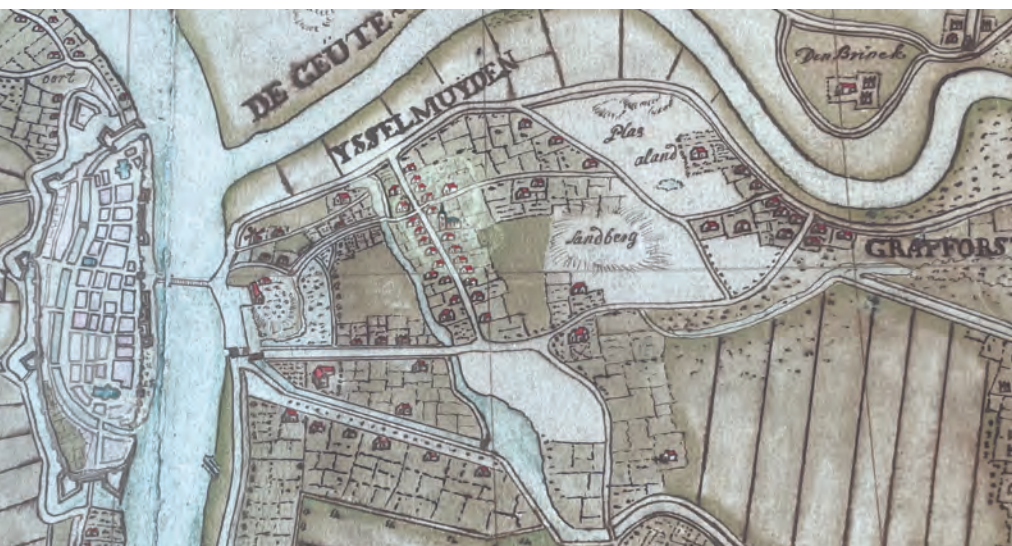
IJsselmuiden met trekvaart naar Zwolle, detail van: 'Caerte van de vrijheyd der stad Campen' uit 1724.