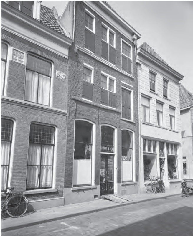
De voorgevel van Voorstraat 116. Juni 1960. Fotograaf G.Th. Delemarre. Bron: Rijksdienst voor Cultureel Erfgoed, documentnummer 060115.