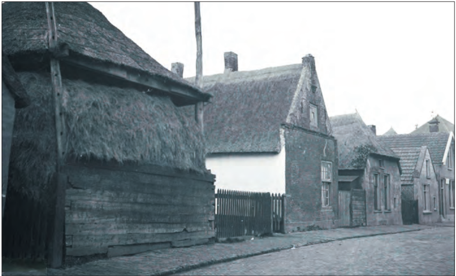
De Dorpsstraat in Brunnepe in 1937.