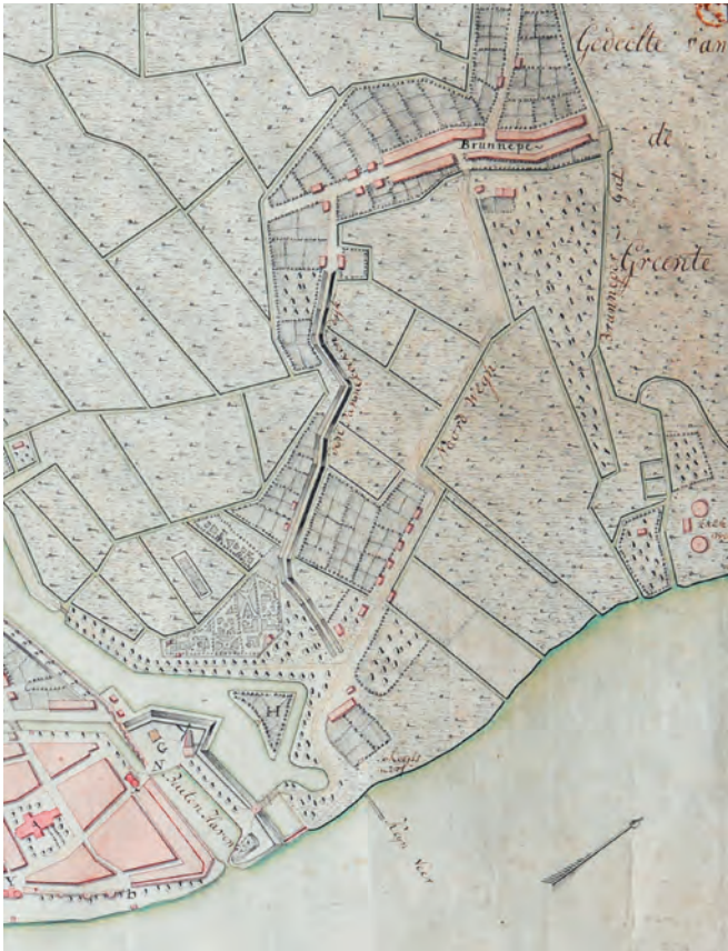
Het oude Brunnepe in 1787. Detail van 'Plan der stad Campen zooals het gelegen was in het jaar 1787'. T.A. Hesselink. Collectie Stadsarchief Kampen, inventarisnummer K000812.