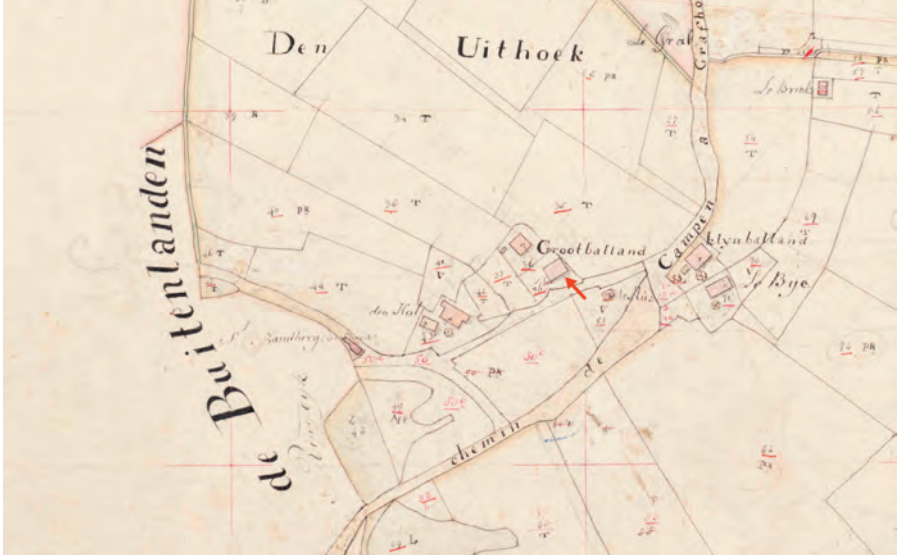
Detail van het kadastraal minuutplan (1811-1832), IJsselmuiden, sectie B, blad 01. De onderzochte boerderij bevindt zich bij de pijl. Rijksdienst voor Cultureel Erfgoed, documentnummer MIN04058B0.