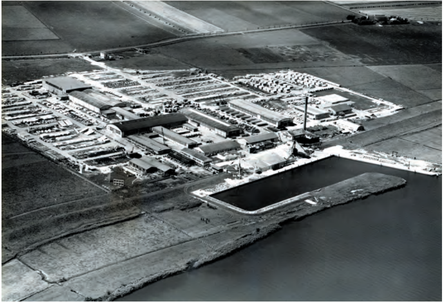
Fabriekscampus van de firma N.V. Schokbeton aan de IJssel in Kampen. 1949.

in 1950, juist toen er een kentering in de textielwereld plaatsvond. Lagelonenlanden vormden concurrentie voor de Nederlandse textielindustrie. Dat leidde in 1958 tot een ontslaggolf van vierhonderd medewerkers. De gestage neergang van de Nederlandse textielindustrie zette ook nadien door. Ondanks intensieve samenwerking met andere bedrijven sloot Jansen en Tilanus in 1981 de deuren. Het bedrijf vervulde in Kampen een belangrijke rol. Lange tijd was het een grote werkgever in Kampen. De hal aan de Industrieweg is het laatste gebouw van dit bedrijf dat nog bestaat.