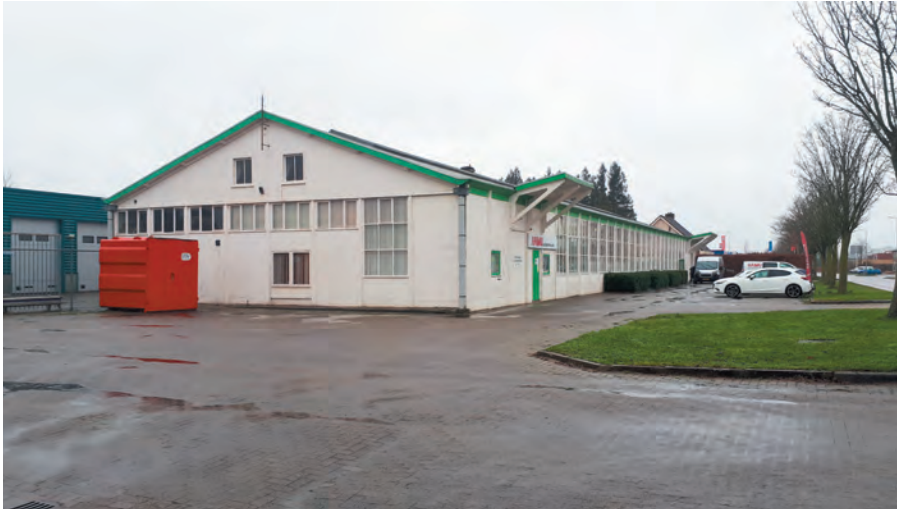
De voormalige fabriekshal van de N.V. Jansen en Tilanus. Foto Annemiek Jonker 2020.

vertegenwoordiging van de modernistische systeembouw en architectuur tijdens de wederopbouwperiode. Het gebouw bezit bovendien enkele karakteristieke, strak vormgegeven architectonische elementen, passend bij de tijd waarin het werd gebouwd, zoals in de voorgevel de lange rij vensters met stalen roeden en uitkragende afdaken boven de twee ingangen, het reliëf in de betonelementen en het flauw hellende bitumen zadeldak. Ondanks de wijzigingen die zijn aangebracht, is het opvallende pand vrij gaaf bewaard gebleven. Het is beeldbepalend voor de Industrieweg. Als een van de laatste relictten van de N.V. Schokbeton binnen de gemeentegrenzen is het een zeldzaam gebouw.