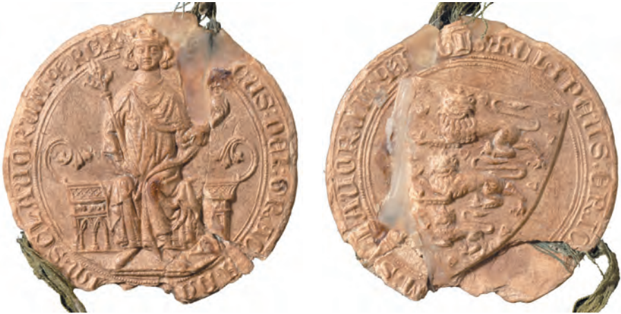
Voor- en achterzijde van het zegel van Erik, koning der Denen en Slaven. Hij was de koning die de privileges van Kampen op Schonen in 1307 bevestigde.