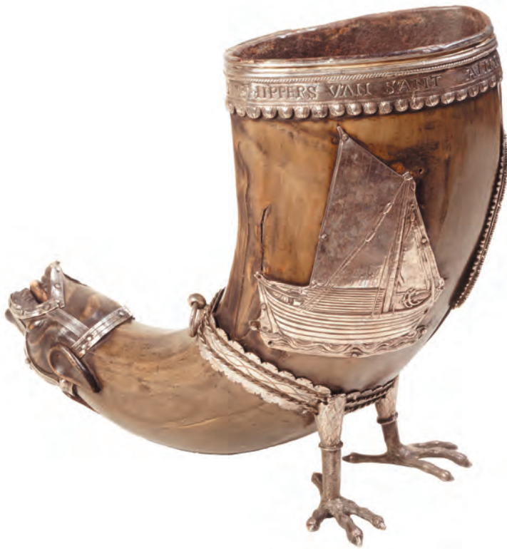
Deze drinkhoorn van het Sint Anna- of Rijnschip-persgilde uit 1369 staat symbool voor de machtige handelspositie van Kampen in de 14de eeuw.

zich toch sterker moest verbinden en eigenlijk steeds meer transformeerde van een belangengemeenschap voor kooplieden naar een verbond. 15 De vorming van de Hanzeatische Confederatie van 1557 is daar een goed voorbeeld van. Deze Confederatie was een poging om de Hanze tegen de opkomende staten te beschermen. Niet alleen moesten de leden de privileges en kantoren van de Hanze verdedigen, ook was het de bedoeling gezamenlijk op te komen tegen een gewapende overval op één van de aangesloten leden. 16 Er werden lijsten opgesteld met steden die tot de Hanze werden gerekend. 17 Al deze maatregelen om tot een hechtere en sterkere handelsgemeenschap te komen, hebben de neergang van de Hanze echter niet kunnen stoppen. Het toont tegelijk aan dat de kracht van de Hanze juist in de flexibiliteit lag.