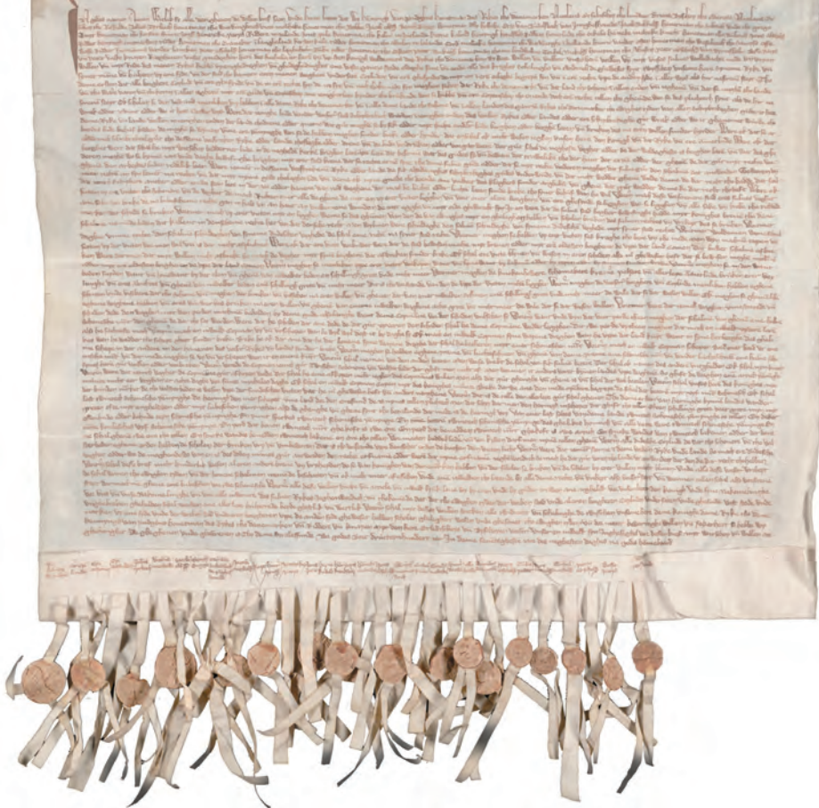
Vredesverdrag tussen koning Waldemar van Denemarken en de stad Kampen, gesloten te Stralsund op 24 mei 1370. Stadsarchief Kampen, Oud Archief, inv.nr. 2034, reg.nr. 89.

Een aantal jaren later, in 1367, werd onder leiding van Lübeck op een Hanzedag in Keulen een grote anti-Deense coalitie gevormd, de Keulse Confederatie. Het doel was om de Deense koning Waldemar IV Atterdag met militaire middelen te dwingen zijn agressieve expansiepolitiek op te geven. Kampen, dat zich een paar jaar daarvoor nog afzijdig hield in het conflict tussen de Hanze en Vlaanderen, had een fors aandeel in de uitrusting van de vloot van de Confederatie. In een eerdere hanzeatische operatie tegen de Deense koning had Kampen zich nog afzijdig gehouden. De IJsselstad besloot in 1367 wel samen te werken met hanzeatische steden, omdat Waldemar ook de Kamper privileges schond. De handelsbelangen in het Oostzeegebied van alle deelnemers aan de Confederatie werden bedreigd. Net als de Noord-Duitse steden had ook Kampen belang bij een ongestoorde handel in dit gebied. Kampen droeg met een kogge en twee rijnschepen met 150