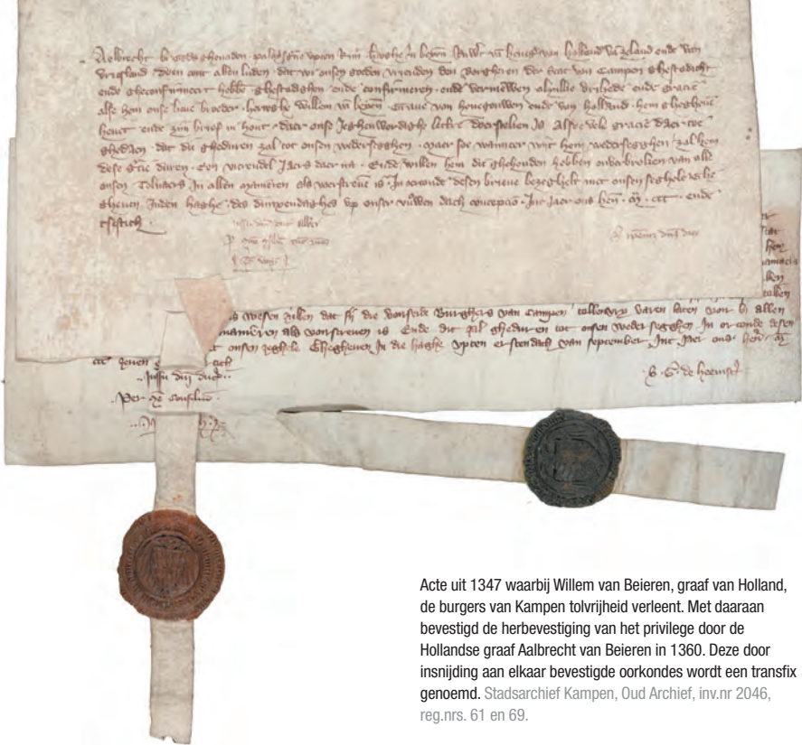
Acte uit 1347 waarbij Willem van Beieren, graaf van Holland, de burgers van Kampen tolvrijheid verleent. Met daaraan bevestigd de herbevestiging van het privilege door de Hollandse graaf Aalbrecht van Beieren in 1360. Deze door insnijding aan elkaar bevestigde oorkondes wordt een transfix genoemd.

Kampen speelde daarin een voorname rol. In 1304 sloot het een handelsverdrag met Dortmund en in een Kamper toltarief van circa 1340 werden de Westfalen als eerste genoemd. Kampen was de belangrijkste haven voor verscheppingen naar het Oostzeegebied. 26