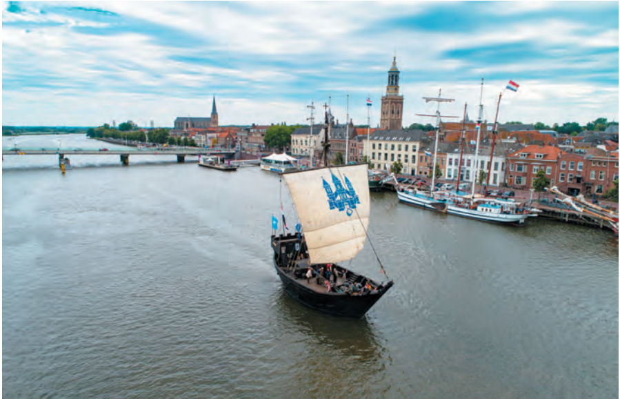
De Kamper Kogge op de IJssel voor Kampen.