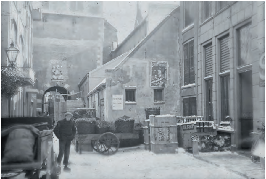
Rechts het pakhuis in de Torenstraat. Op straat de manden en kisten met 'steengoed' die vanaf het station werden aangevoerd met een handkar.