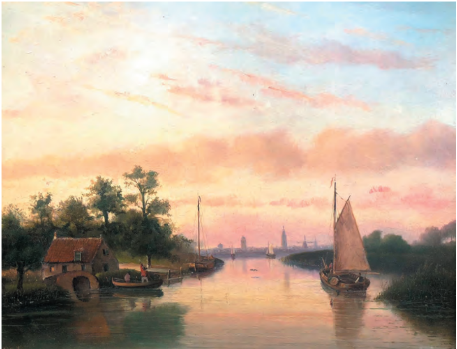
Tjalken bij ondergaande zon. Olieverf op paneel, 42 x 31 cm. Collectie Kunsthandel Biesta & Smink.

Ver van welk front dan ook en met een nieuw opleidingsinstituut onder zijn handen lachte het leven overste Van Mulken bij terugkeer in Kampen toe. Drie jaar lang - de standaardtermijn voor militaire benoemingen - vond hij voldoende tijd en rust om niet alleen zijn jonge militairen maar ook zijn geboortestad te 'verheffen': de militairen met educatie, de stad met culturele en maatschappelijke impulsen.