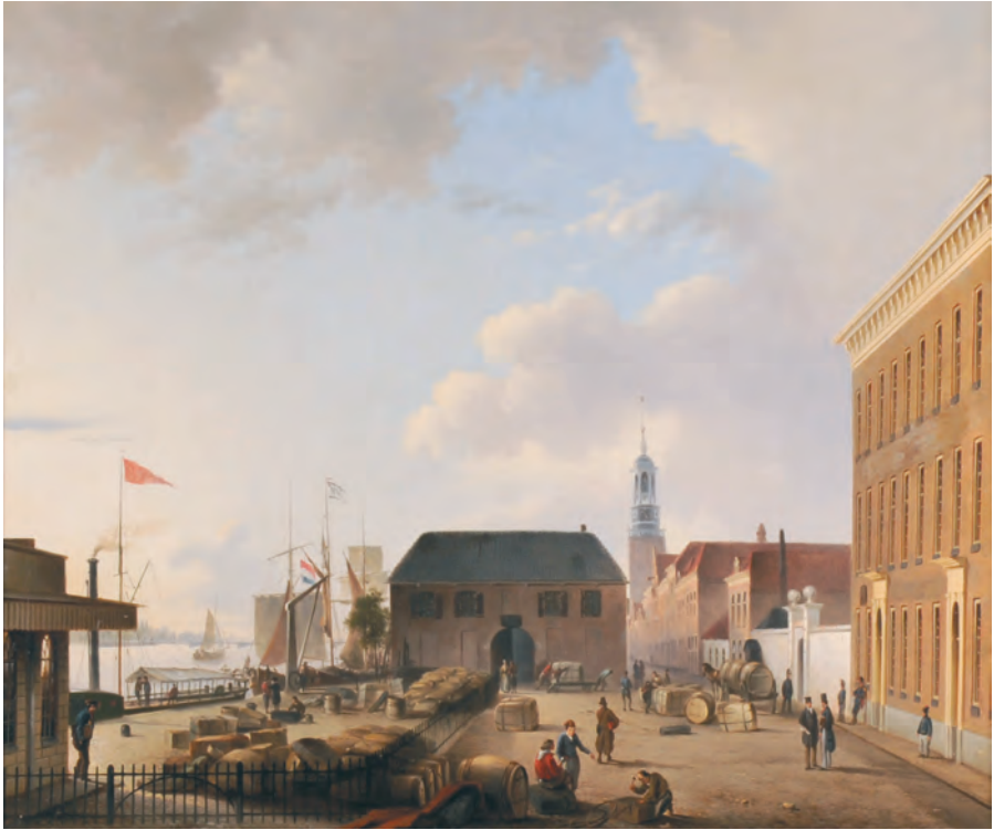
J.J. Fels (1846). Plein voor de kazerne van het Instructiebataljon. Olieverf op doek. Collectie Stedelijk Museum Kampen.

en konden ook burgers er gebruik van maken. Na Van Mulkens vertrek uit Kampen in november 1853 onderging de zweminrichting nog diverse aanpassingen en verhuizingen, maar de commandant van het IB geldt als de initiator ervan.