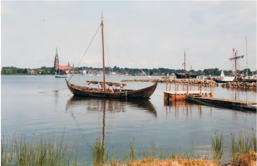
Gezicht op de stad Schleswig (Sleeswijk) over de fjord de Schlei. De Sct Petri-Domkerk, waarin koning Abel aanvankelijk was bijgezet, steekt duidelijk boven de bescheiden bebouwing uit. De neogotische toren is in de 19de eeuw toegevoegd. Het scheepje op de voorgrond is een replica van een vaartuig uit de Vikingtijd. Foto F. D. Zeiler, 2012.

de Oostzee later de bijnaam 'Sejr' ('Overwinning') verwierf. Toen Valdemar in 1241 stierf was de oudste zoon Erik de natuurlijke opvolger. Deze raakte verwickeld in een partijstrijd tussen zijn getrouwen en de aanhangers van Abel, die zich vooral in het grensgebied met Duitsland bevonden. Hier, in wat later Sleeswijk-Holstein werd genoemd, was al de kiem gelegd voor een conflict over de beheersing van het gebied dat tot ver in de 20ste eeuw zou blijven voortbestaan. Het hertogdom Sleeswijk, gelegen ten noorden van de Eider, was aanvankelijk overwegend Deens, maar kwam door immigratie vanuit het zuiden steeds sterker onder Duitse invloed. Holstein was een smeltkroes van Wenden (West-Slaven), Friezen en Duitsers, maar het Duitse element kreeg op den duur de overhand, waarbij de regionale adel een beslissende rol zou gaan spelen.