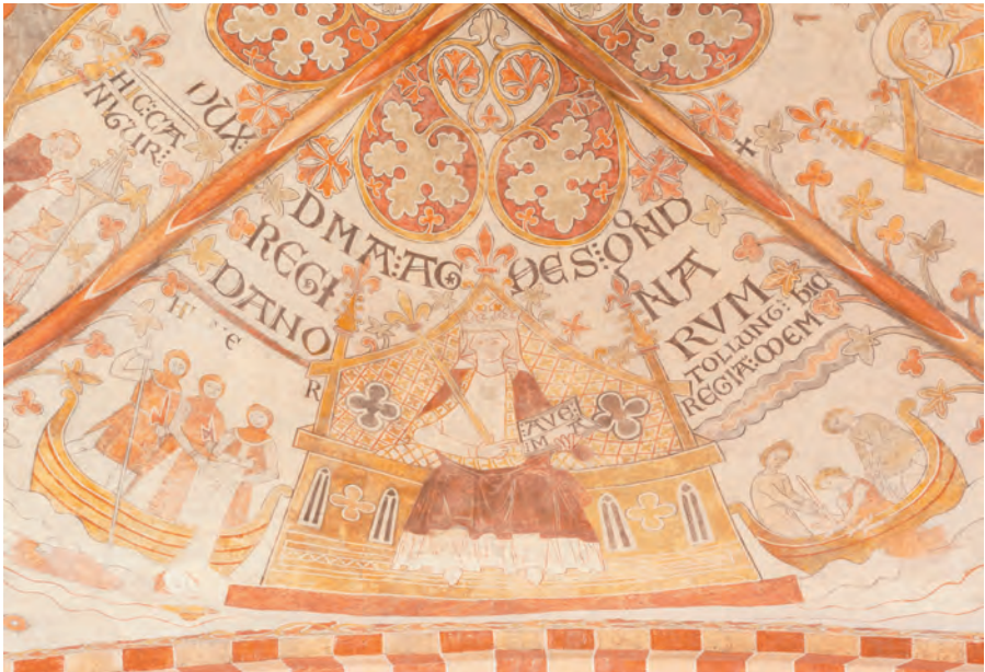
Kalkschildering op het kruisgewelf in de Sct Bendtskirke (kerk van de H. Benedictus) in Ringsted, Denemarken. In het midden troont Agnes, weduwe van de vermoorde koning Erik Plovpenning. Links is de moord op Erik afgebeeld, rechtsonder laat zien hoe vissers het lijk in de Schlei hebben gevonden.

opstandelingen te ontkomen, maar bij de brug van Husum wisten dezen hem te achterhalen en met een pijlschot dodelijk te treffen (29 juni 1252). Het is merkwaardig dat nog geen vier jaar later een andere vorst hetzelfde overkwam, maar dan in de strijd tegen de Westfriezen: graaf Willem II van Holland, die werd gedood bij Hoogwoud (eind januari 1256). Anders dan in dat geval, waarbij de zoon (Floris V) uiteindelijk wraak nam op de opstandige dorpers, wisten de Friezen van Eiderstedt tot in de 16de eeuw een soort onafhankelijke republiek te handhaven. De positie daarvan is wel te vergelijken met de Stellingwerven tussen het Oversticht en het gewest Friesland, die tussen 1313 en 1498 baas op eigen erf waren.