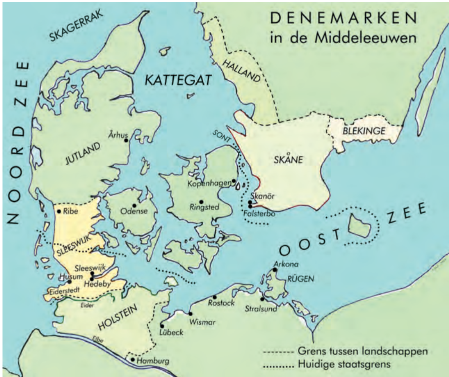
Kaartje van het gebied rond de Oostzee met enkele voor de Hanze belangrijke steden

Men zou zelfs een directe relatie kunnen leggen tussen het aanleggen van de Koopmansgilderol van Deventer in 1249 en de Abelsprivileges. Uit alle steden in het achterland, in ieder geval de genoemde vier, kwamen reders bijeen die hun schepen bij de overslagplaats aan de IJsselmond gezamenlijk bevrachtten voor de tocht om Jutland heen naar de Sont. Deventer speelde een cruciale rol in de uitvoer van luxe lakense stoffen. Ter vergelijking kan dienen dat koning Abel in hetzelfde jaar een privilege voor de rechten op de jaarmarkt verstrekke aan de burgers van Rostock, terwijl ook de inwoners van Hamburg, Lübeck en Wismar op eenzelfde manier door hem werden bedacht. Hier ging het dus al om groepen belanghebbenden in één stad. De Deense politiek was, zoals de wereldgeschiedenis zo vaak leert, er één van militair vertoon naast diplomatie en gunstverlening. Had de weg van onderhandeling geen resultaat, dan werd er een leger op af gestuurd en omgekeerd. Daarbij wisselden coalities en oorlogsverklaringen vaak per jaar.