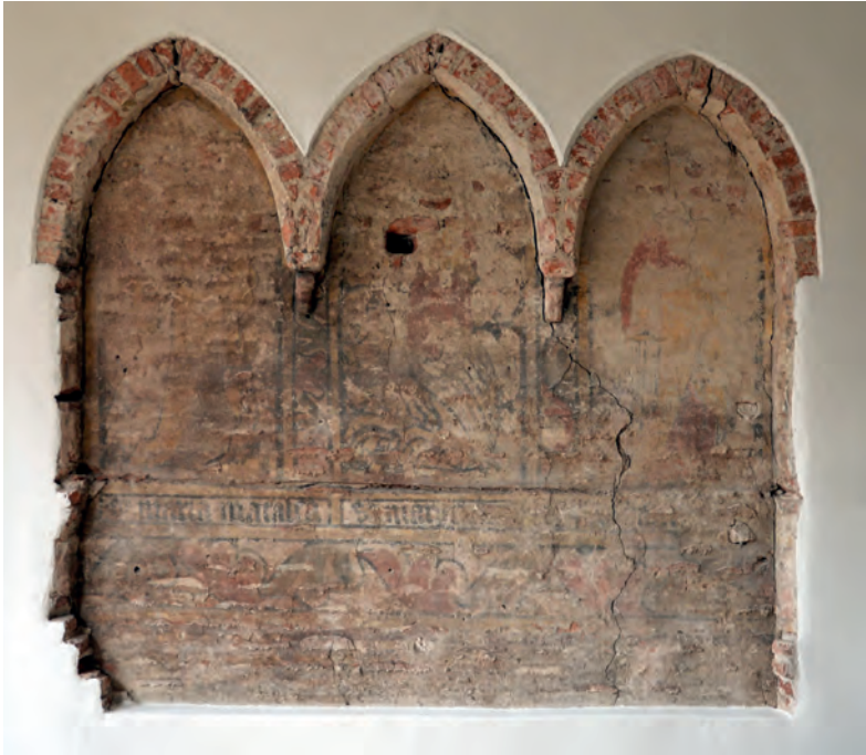
Muurschildering in het pand Oudestraat 162-Houtzagerssteeg 3.

nen uit de nissen zijn ze in het zicht gekomen. Er is een waardestelling en conditieopname uitgevoerd door kunst- en interieurhistoricus de heer R. Harmanni en restaurator mevrouw R. Keppler. Ook heeft de heer G.J. van der Schee een bouwhistorisch onderzoek uitgevoerd, waarvan het rapport nog moet verschijnen.