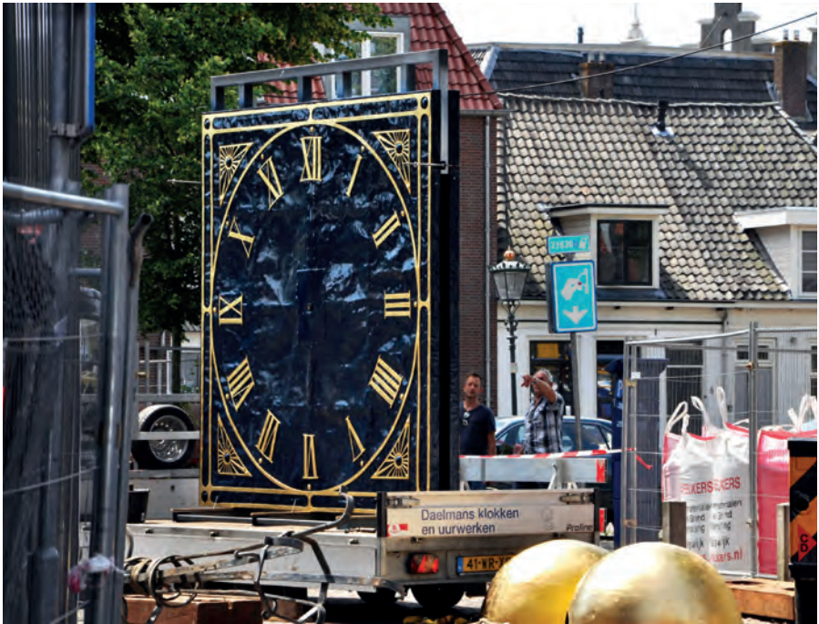
De wijzerplaten worden weer teruggeplaatste. 24 juni 2019.

Na elke restauratie wordt een koker met brieven verstoppt in de ballon. In die brieven staat welke werkzaamheden zijn uitgevoerd. Zoals in 1878, toen de heer G. van Aalderink de ballon vernieuwde en B.J. ten Dam met zijn knecht G. Zegeling de haan opnieuw vergulde en de bliksemafleider 'nazag'. Of in 1963, toen de weerhanen van de Bovenoren, Nieuwe Toren en Buitentoren alle drie werden vernieuwd. Daarbij werd het torenkruis stevig vastgezet, omdat het bij hevige wind heen en weer zwaakte. Ondanks het beter vastzetten van het kruis waaide de haan tijdens de storm van 13 november 1972 van de toren af en is er in 1975 weer opgezet. Het muurwerk en de waterlijsten zijn in 1998-1999 gerestaureerd naar plannen van bureau Delfgou. Maar de grote vraag is nu: wat hebben wij in 2019 in de koker verstoppt? Daar komt de volgende generatie achter.