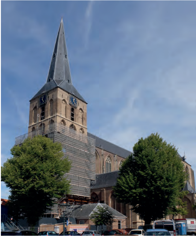
De Bovenkerk in de steigers. Februari 2019.

onder andere aan de tufsteengevels. Na ontvangst van de subsidieaanvraag werden de aanbestedingsstukken gereedgemaakt. In het najaar van 2018 is samen met experts een aanvullende warme opname uitgevoerd. Dit is een gedetailleerde opname vanaf de steigers, waardoor de werkelijke staat van het tufsteen bepaald kon worden. Gezamenlijk is het daadwerkelijke schadebeeld van de gevels vastgesteld. Uit deze opname bleek dat er nog veel meer tufsteen vervangen moest worden. Er werd besloten om de hoeveelheid te vervangen tufsteen te verhogen van 95 vierkante meter naar 170 vierkante meter. In januari 2019 begon men in de bovenste geleding. Dat is de laatst toegevoegde verhoging van de toren, die plaatsvond in de periode 1563-1565. Die verhoging zou ertoe geleid kunnen hebben dat de toren al in de 17de eeuw stabiliteitsproblemen vertoonde. Een andere aanleiding kunnen veranderingen in de ondergrond zijn, bijvoorbeeld een wijziging in de grondwaterstand. Vervolgens werkten de voegers naar beneden tot in fe-