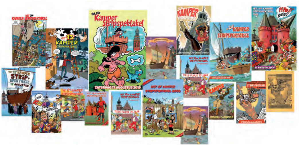
Het Programmaboekje door de jaren heen. Collage: Remy Steller.

Kamper Uiensoep , een verzameling van 25 oude en nieuwe 'Kamper uien'. Het is bij elkaar toch al een behoorlijk rijtje. De oproep van burgemeester Oosterhof is niet vergeefs geweest.