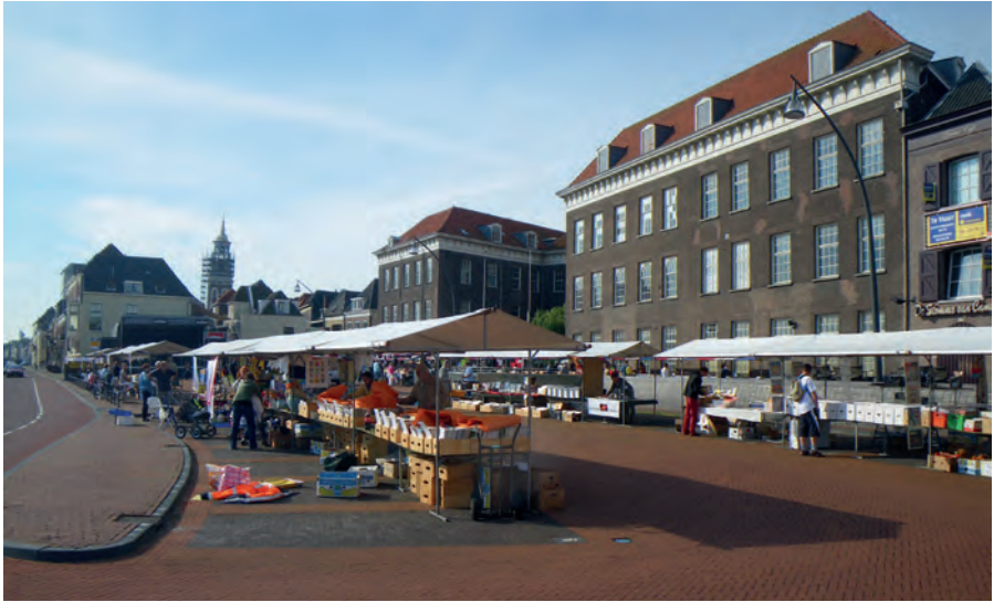
Al tijdens de opbouw van de stripmarkt in de vroege morgen komen de eerste verzamelaars een kijkje nemen (2008).