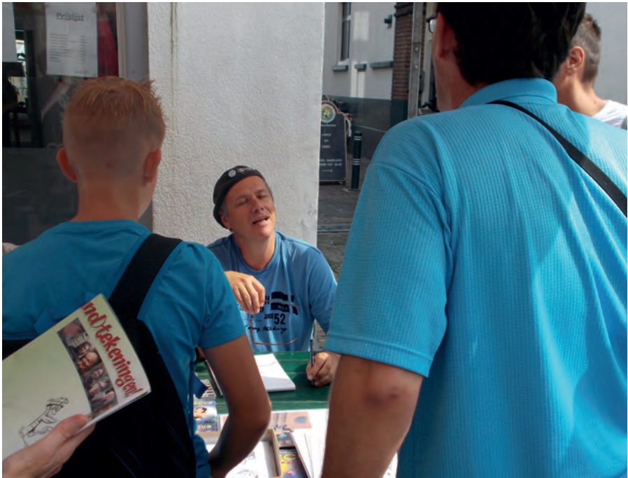
Veel belangstelling voor Marq van Broekhoven.

stripdag? Na een korte stilte volgt er een homerisch gelach. Dubbelzinnige grappen vliegen over de tafel, maar het idee wordt direct aangenomen. Met een grijnzend 'Paul gaat strippen' en het nodige gegrinnik van de bestuurstafel krijg ik de opdracht om een plan uit te werken. Er wordt geen volledige dag aan dit thema opgehangen, maar als toevoeging voor de laatste Ui(t)dag kan het zeker werken.