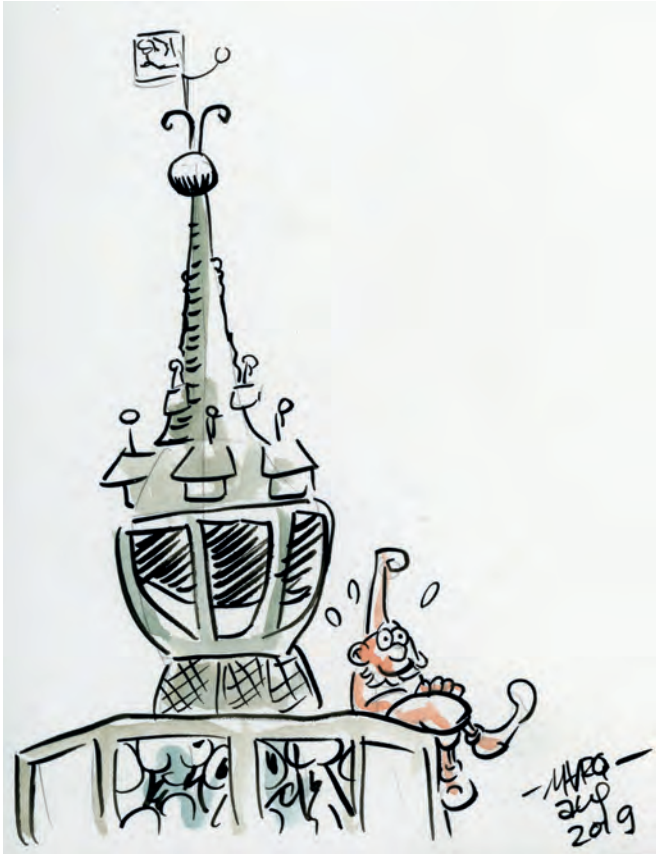
Peer de Plintkabouter op de Schepentoren door Marq van Broekhoven. Collectie: Remy Steller.

bijzondere aandacht besteed aan dit aspect van stripezen, maar ook aan lezen in het algemeen. Leesbevordering is inmiddels een van de pijlers van het Stripspektakel. In samenwerking met Bibliotheek Kampen worden verschillende projecten aangeboden, er komen auteurs van (kinder)boeken en er wordt gratis standruimte aangeboden aan projecten die met lezen en leesbevordering te maken hebben.