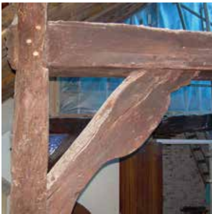
Eén van de bijzondere korbelen met de in- en uitbuikende vorm in de boerderij Bergweg 24.

In de loop der tijden zijn aan beide boerderijen veel veranderingen aangebracht. Bergweg 24, met een oppervlakte van 14 x 10 meter, is oorspronkelijk gebouwd als driebeukig hallehuis, dus met aan beide zijden een lage zijmuur. Bergweg 28 met een oorspronkelijke oppervlakte van 14.5 x 9 meter, is gebouwd als tweebeukig hallehuis, met één hoge en één lage zijmuur. Beide huizen hadden voorin een woongedeelte en daarachter een stal. Bij Bergweg 28 is in de lage zijmuur nog een mestluik aanwezig, bij nummer 24 zijn twee mestluiken bij een eerdere renovatie verdwenen. Bij nummer 28 is omstreeks 1870 een zijvleugel aangebouwd, terwijl de voorgevel dateert van 1910. 113