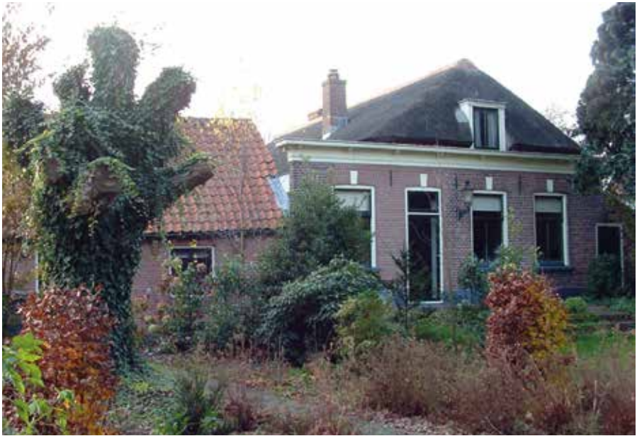
De voorgevel van Groot Balland, 27 november 2011.