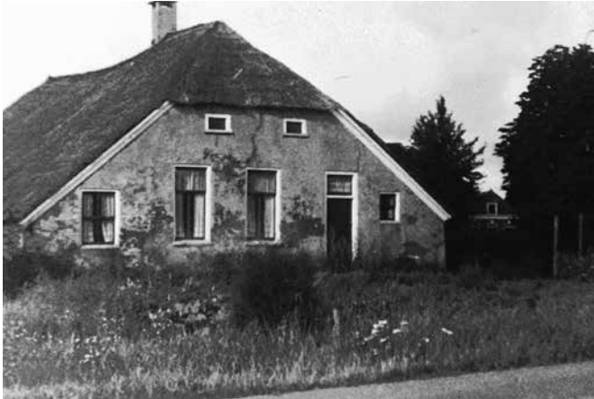
De voorzijde van Klein Balland kort voor de afbraak, zomer 1978. Op de achtergrond is Groot Balland te zien.