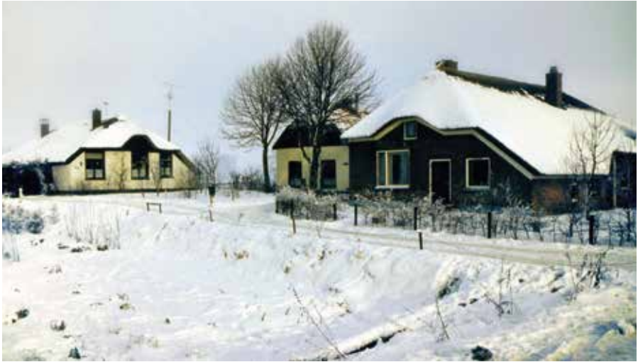
Winter 1981. Links het oorspronkelijke Holtsende, Bergweg 24. Rechts de later bijgebouwde boerderij, die nu de naam Groot Balland draagt.

was en Johan Aerntsz en zijn zoon de pachters. Verdere bijzonderheden ontbreken. 9 Opmerkelijk is dat hier (voor het eerst?) de topografische naam Holtsende werd gebruikt. De familienaam Van Holtsende daarentegen kwam al omstreeks 1300 voor. Het goed Holtsende komt niet in de leenregisters voor; het was een allodiaal goed, dus vrij eigendom van de familie. In 1484 was er een geschil over het vissen in de kolk te Holtsende; uit 1495 is er een rentebrief ten laste van het erf Holtsende, gelegen bij de 'Ysselmuider berch'. 10 Waar de genoemde kolk precies gelegen heeft is niet bekend; de kolk wordt in latere archiefstukken ook niet meer genoemd.