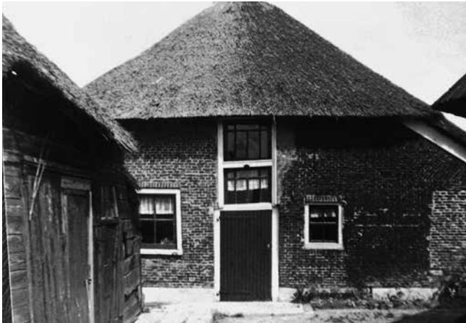
De achterzijde van Klein Balland, zomer 1978. Opmerkelijk is het dubbele bovenlicht van de deur.