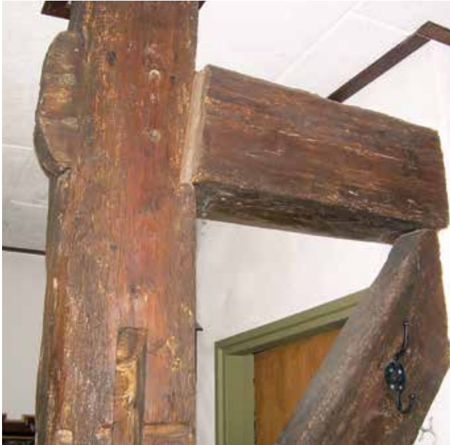
Gebint in de boerderij Bergweg 28. Onderaan de foto is in de gebintstijl een keep met toognagelgat te zien.