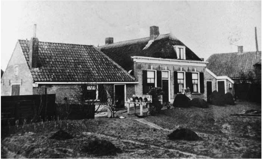
Groot Balland in 1938, noordoostzijde. De voorgevel daterend van 1910, links de zijvleugel van ongeveer 1870.

strekke penningen en achterstallige renten, totaal 1.800 carolusguldens. De schuld moest voldaan worden uit de opbrengsten van ‘erven ende goederen groot ende klein Balandt’. 70