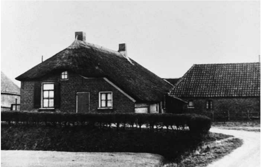
Groot Balland in 1938, zuidwestzijde.

Suchtelen uit Deventer, aanpandinge en opbadinge wegens achterstallige rente (de 100 carolusguldens per jaar) uit de erven Groot en Klein Balland. Er werd beslag gelegd op de 'levendige haeve, gewas en andere gereet goet' van die erven. Dr. Hanius had vernomen, dat dr. Meyer goederen op Klein Balland gerichtelijk had laten verkopen en maakte ook aanspraak op de opbrengst hiervan. 74 Beide heren konden het niet eens worden en telkens werd de zaak weer uitgesteld. 75