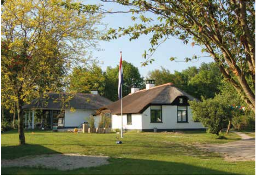
Het tegenwoordige Houtsende met de nieuwe zijvleugel in 2011.

van Vrijzinnige Hervormden in Kampen. De laatste pachter, tot 1964, was de familie Bottenberg. 111