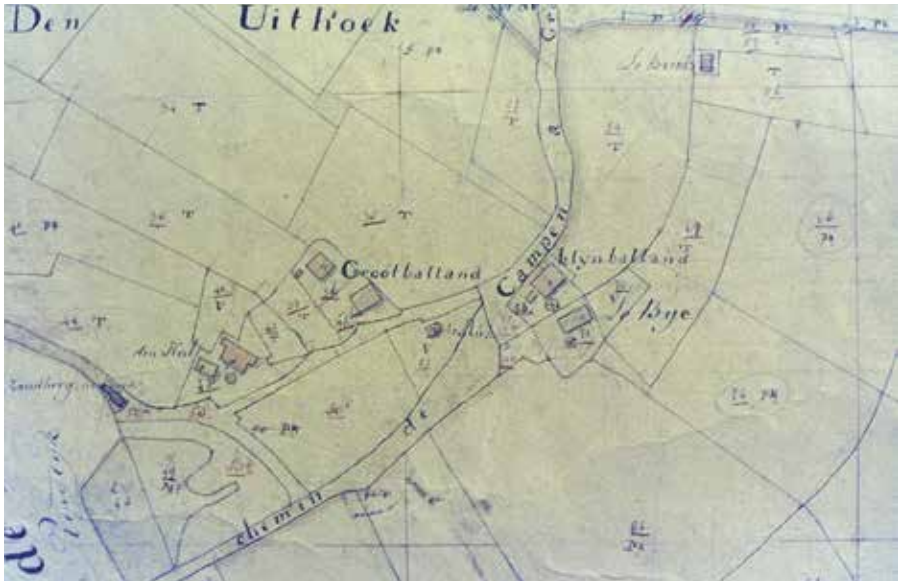
Detail van het kadastrale minuutplan van 1 augustus 1818, IJsselmuiden Sectie B1. Midden over het kaartje zien we de 'Chemin de Campen à Gra(h)forst', in de taal van de Franse bezetter, die kort tevoren het kadaster in ons land had ingevoerd. De Bergweg is duidelijk te herkennen. Rechts van het woordje Chemin ligt nu de rotonde waar de Plasweg op de Gra(h)forsterweg uitkomt. Links onderaan het kaartje zien we De Plas, en links daarvan de Gra(h)forsterberg. De huidige percelen Bergweg 24 en 28 zijn te herkennen aan de naam Groot Balland.