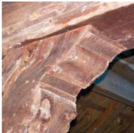
Detailopname van het ojiefprofiel bij de aansluiting met de dekbalk.