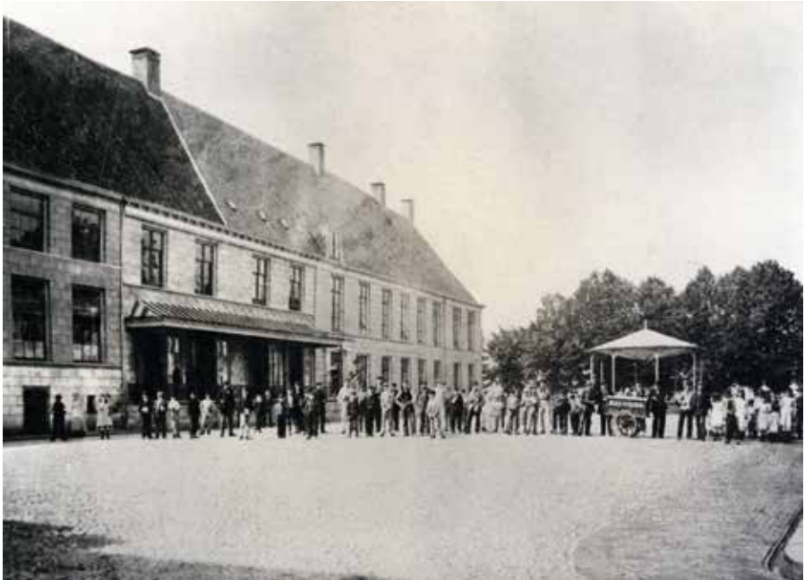
De Nieuwe Markt in 1878 met links Hotel des Pays Bas, dat in 1851 in het voormalige Collegegebouw werd gevestigd. Foto H.W. Wollrabe, hoffotograaf te Den Haag, 1878; Gepubliceerd in een album opgedragen aan burgemeester De la Sablonière; SNS Historisch Centrum / Frans Walkate Archief.