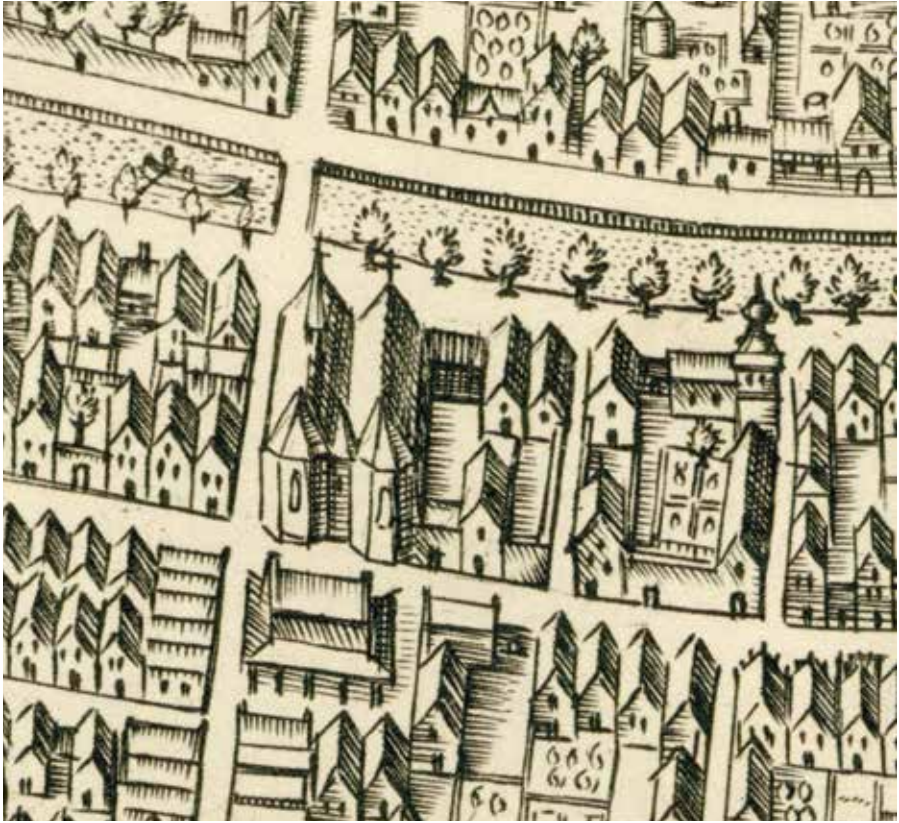
Het Broederklooster met rechts daarvan de ommuurde kloostertuin met bijgebouwen; rechts van de tuin loopt de Spijkerboersteeg. Detail plattegrond Paulus Utenwael, 1598.

Ducksz, werd aangezegd dat hij zijn 'getijmmer' op het terrein moest laten afbreken. Het betrof een afdak op een stuk kloosterhof van 20 bij 30 voet, dat hij sinds 1623 voor 3 goudgulden per jaar, tot wederopzegging van de magistraat, mocht gebruiken om er een brouwketel onder te plaatsen. 4 Eerst in juni 1630 werd hem in aanwezigheid van twee getuigen in omflooerste beoordelingen - hij was tenslotte gemeensman - voorgelezen dat hem tot Pasen 1631 de mogelijkheid werd geboden het afdak af te breken; daarna zou de overheid het op Derck Ducksz' kosten laten doen. 5 De conrector van de Latijnse school, Johannes Petri, moest ook verhuizen, een feit dat hij blijkbaar zonder protest accepteerde. Hij mocht dan ook in de buurt van de school een ander huis huren. 6