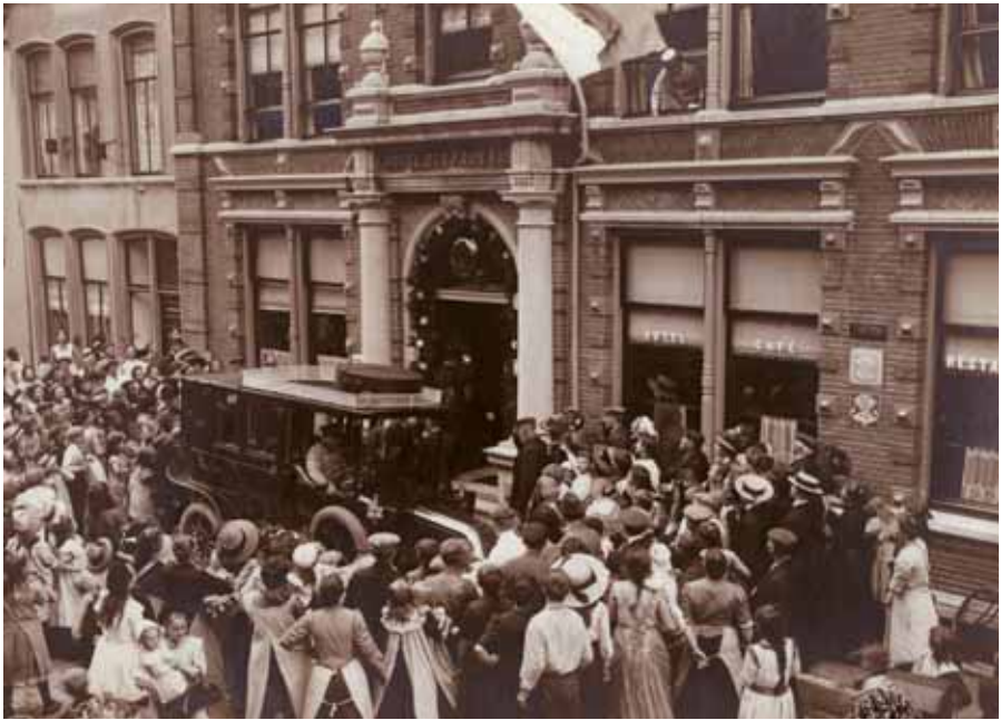
De aankomst van Prins Hendrik in 1913 bij Hotel des Pays Bas bracht veel mensen op de been, die hem zonder noemenswaardige beveiliging konden 'bezichtigen'. De prins zelf is op deze foto nauwelijks te zien. Het is overigens de vraag of de meeste toeschouwers het hadden gemerkt als er iemand anders in zijn pak had gezeten: zoveel afbeeldingen van de prins zullen er niet hebben gecirculeerd.

spiegel en in de eetzaal, waar zeer kunstig op den eenen spiegel een boeket geteekend was, en op den anderen: Hulde aan Z.K.H. den Prins der Nederlanden.' In de tuin was een borstbeeld van Willem I geplaatst, 'die kon niet anders dan bij den Prins herinneringen aan 1813 wakker roepen, welke overigens langzamerhand wakker genoeg zullen zijn geworden', aldus de verslaggever van de Kamper Courant . Na afloop van de vergadering 'werd het noenmaal in het hotel gebruikt', waarna ongeveer dertig commissarissen een rijtoer naar de Koekoek en Kampereiland maakten. Half zes was het gezelschap terug in de stad en vertrok de prins naar het Loo. 14