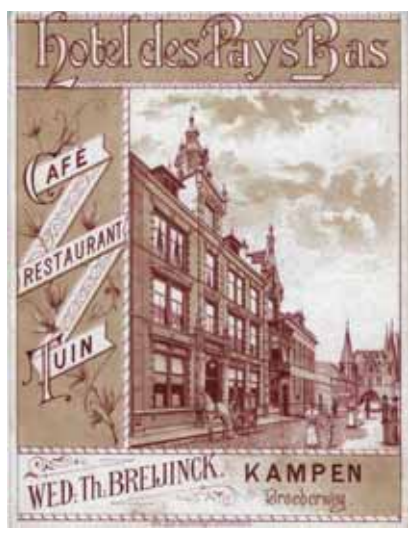
Reclame-uiting voor Hotel des Pays Bas, waarschijnlijk vervaardigd kort na de bouw (1889), toen men nog reisde met paard en wagen. Het hotel beschikte over een eigen koets-huis.