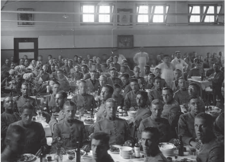
Diner met leerlingen van de SROI, jaren dertig.

nomie en verhuizen naar het nog maar net verlaten Grootburgerweeshuis aan de Cellebroedersweg, dat voor de zoveelste keer moet worden verbouwd. De kapitaalvernietiging voor de instelling is aanzienlijk. De vroegere burgerwezen ervaren het echter als een vooruitgang. Het leven in het veel rijkere Grootburgerweeshuis is luxer en comfortabeler. Het complex aan de Vloeddijk ondergaat ondertussen een grondige aanpassing. Op de zolderverdieping komt een militaire slaapzaal. Verder bouwt men tussenwanden, haringgraatplafonds, kasten en toiletten bij. De linnenkamer wordt officierskamer en de ziekenkamer en badkamer voor jongens een verblijf voor kwartierzieken en de onderofficier. In 1926 wordt het gebouw, dat plaats biedt aan tweehonderd leerlingen, heropend. Vier jaar later doet de school voor reserveofficieren der militaire administratie, vallend onder het SROI, zijn intrede. Uitbreidingsplannen in de jaren die volgen, stranden door de dreigende oorlog. Uiteindelijk verlaten de meeste legeronderdelen de stad in verband met de mobilisatie.