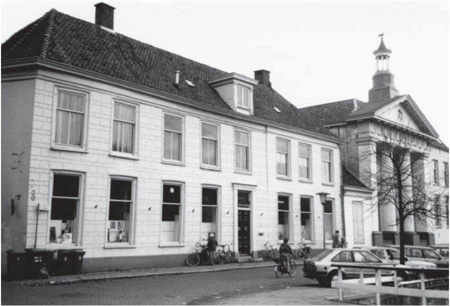
't Speelwerk op de voormalige locatie aan de Burgwal. 1987.

den geleverd aan de ontplooiing van het creatieve vermogen van de mens'. De aangegeven middelen hierbij zijn cursussen en het samenwerken met andere instellingen. In de jaren negentig wordt 't Speelwerk omgedoopt tot Centrum voor Kunstzinnige Vorming met bijbehorende statutenwijziging: 'De stichting ontwikkelt de artistieke vermogens van mensen met middelen die ontleend zijn aan alle disciplines van de professionele kunstbeoefening.' Een duidelijke verbreding van de doelstelling. Maar er staat de stichting nog een inhoudelijke, ingrijpende wijziging te wachten. Omdat zowel de muziekschool als 't Speelwerk al vele jaren klagen te kampen hebben met gebrekkige locaties, wordt al in een rapport daterend uit 1988 gesteld dat er binnen de nieuwe ruimte die voor een moderne muziekschool gezocht werd, ook rekening gehouden moest worden met de integratie van de activiteiten van 't Speelwerk. Op 14 december 2000 neemt de Kamper gemeenteraad het historische raadsbesluit om ruim 11 miljoen gulden beschikbaar te stellen voor de verbouwing van de Vloeddijkkazerne als huisvesting voor een centrum voor kunsteducatie. Op 1 januari 2001 zou de gemeentelijke fusie tussen Kampen en IJsselmuiden een feit zijn. 'Het is nu of nooit', moet het college waarschijnlijk gedacht hebben.