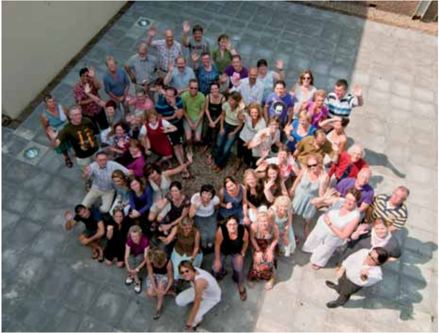
Het Quintusteam anno 2010.