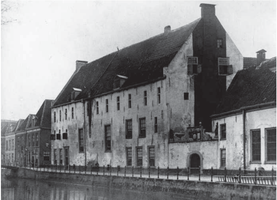
De voormalige kloostervleugel aan de Vloeddijk, afgebroken ten behoeve van de nieuwbouw in 1889. De middeleeuwse opzet is nog goed herkenbaar. Rechts het weeshuispoortje in zijn oude hoedanigheid. Foto genomen kort vóór de afbraak.

zijn gaar. Bijna zeventig jaar (!) pijnlijk touwtrekken is het gevolg, met onder andere een acht jaar durende rechtszaak tussen de gemeente Kampen en de regenten. In 1923 valt de uiteindelijke beslissing. Hoewel de zelfstandigheid van beide gestichten zal worden gehandhaafd door de administraties te scheiden, wordt er een gemeenschappelijk reglement vastgesteld, dat door een gemeenschappelijk bestuur als college van regenten wordt uitgevoerd.