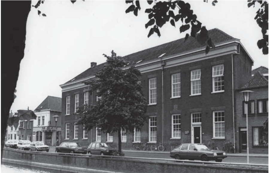
Het gebouw waarin de voormalige Gemeentelijke Muziekschool jarenlang was gevestigd. Vloeddijk 159 A.