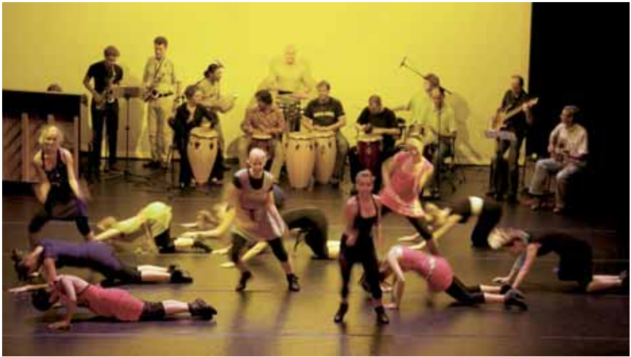
Het nieuwe Quintus biedt een perfecte combinatie van disciplines, zoals muziek en dans.

workshops, maar ook zaalverhuur en het fungeren als eventlocatie. Wat ik na mijn pensioen ga doen? Daar ben ik nog helemaal niet mee bezig. Er is hier nog veel werk te verrichten met het oog op de toekomst. Een toekomst waarin ik overigens alle vertrouwen heb. Ik woon in Epe en ben altijd fluitend naar mijn werk gegaan, alleen al vanwege de prachtige omgeving en de mooie binnenstad van Kampen. Maar Kampen is ook een buitengewoon culturele stad. Overal worden kunsteducatiecentra gesloten en afgebroken: Zwolle, Leeuwarden, Den Haag. Met zoveel culturele instellingen binnen haar poorten, waaronder natuurlijk Quintus, kan Kampen trots zijn op zichzelf.'