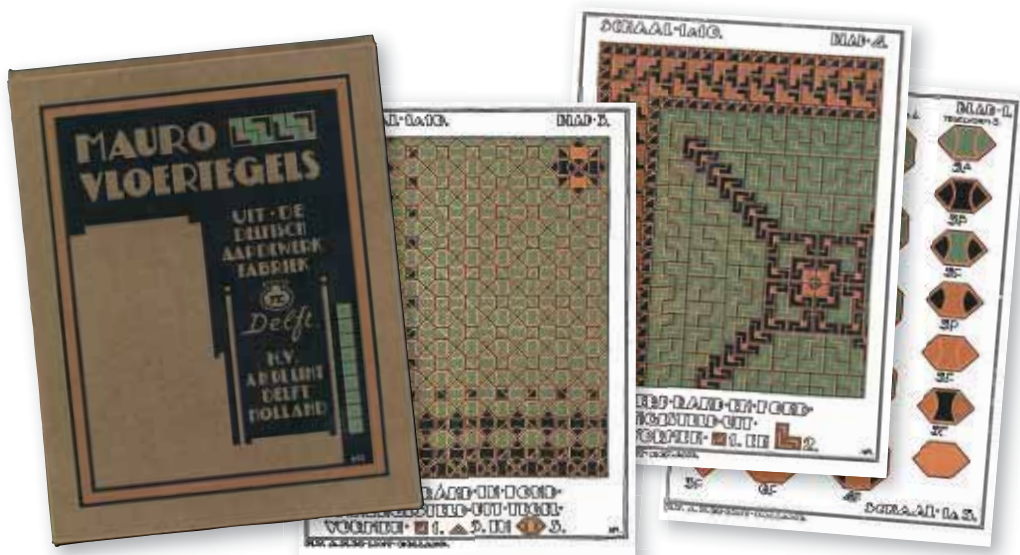
Brochure voor Maurovloertegels van NV A.H. de Lint te Delft.