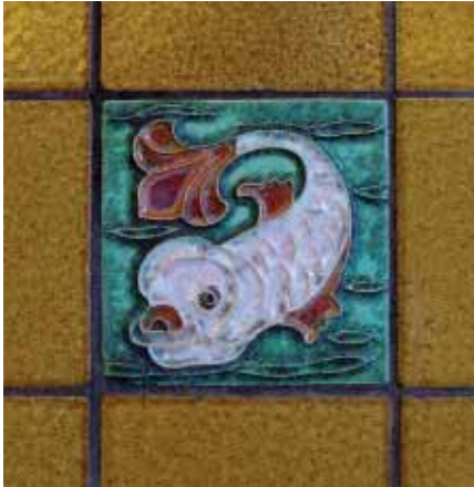
Detail van de schouw in de studiezaal (voormalige bestuurszaal) van het SNS Historisch Centrum. De tegel met de afbeelding van een vis is vervaardigd bij de Porceleyne Fles te Delft.