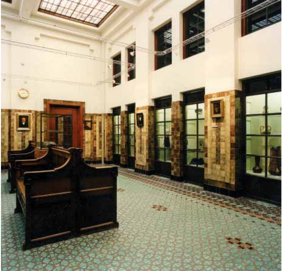
Overzicht van de bankhal van het SNS Historisch Centrum.

stond de unieke kans om het oude bankgebouw van architect Hoekzema, dat inmiddels een Rijksmonument was geworden, waardoor in- en exterieur beschermd zijn, weer in de oude staat terug te brengen. Ooit weggebroken muren werden hersteld, installaties en andere voorzieningen gescheiden. De indeling kreeg zijn oude logica terug en het Frans Walkate Archief, dat door de komst en groei van het SNS Historisch Archief steeds krappere was komen te zitten, kreeg - en passant - de beschikking over meer ruimte. Het herstel van de oorspronkelijke situatie was een goede aanleiding om een opvallend aspect van het monumentale bankgebouw in dit etalage-artikel onder de aandacht te brengen: de mozaïekvloeren in de bankhal, één van de meest markante elementen van het authentieke interieur.