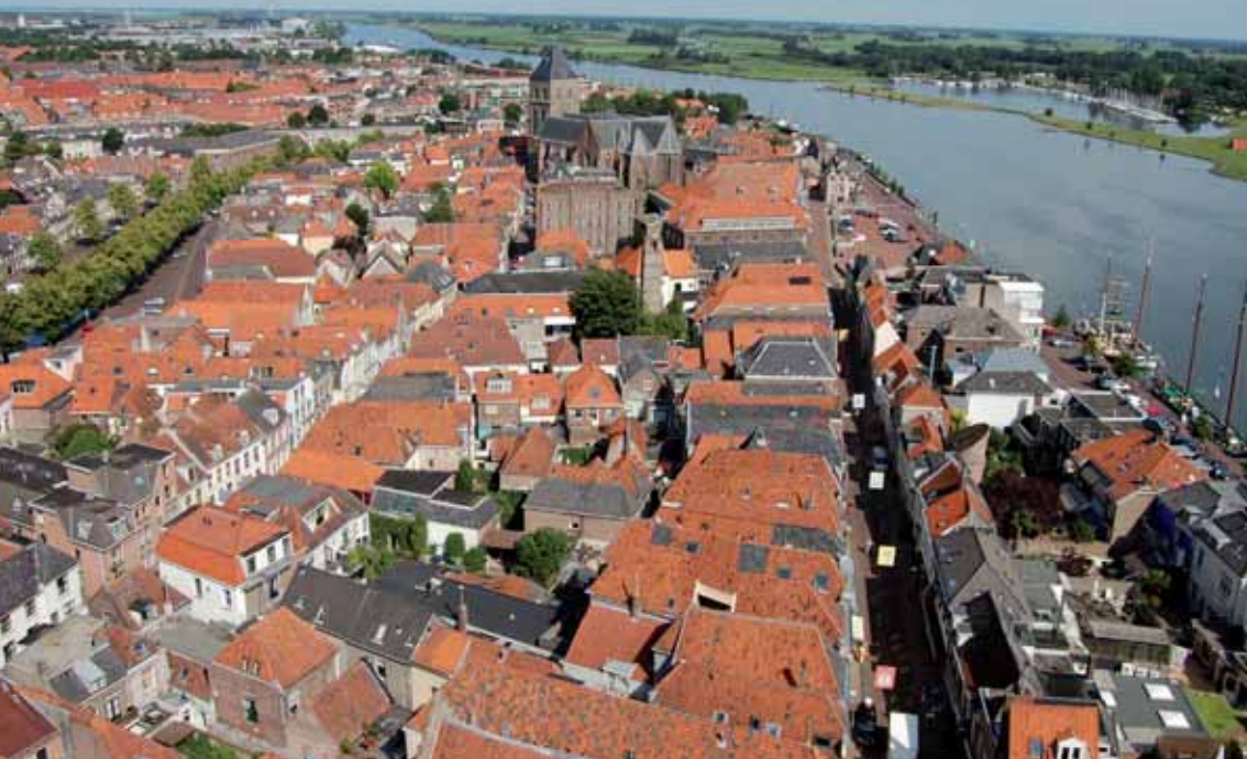
Het dakenlandschap van Kampen.

maar is daarbij ook van groot belang voor het “ensemble” van historische IJsselsteden in het oosten van het land, de provincie Overijssel, en Nederland als geheel.’