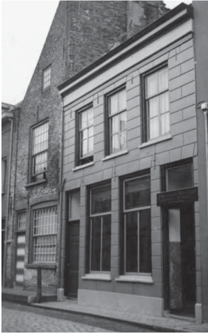
Achterzijde Gotisch Huis (links). Foto Collectie Frans Walkate Archief.

bouwkundige vormgeving in het voorgebouw. In die zin kan er dezelfde ouderdom aan gegeven worden. Men zou kunnen denken dat het derhalve altijd bij het complex behoort heeft. Maar dat is niet zeker, want bij de verkoop in 1645 van het voorhuis bleek het perceel aan de achterzijde aan andermans eigendom te grenzen, waarbij men onwillekeurig denkt aan een perceel in de Buiten Nieuwstraat. Al spoedig na 1915 ontwikkelde zich de gedachte in het complex de bibliotheek-leeszaal onder te brengen, waardoor aan het aan de Buiten Nieuwstraat grenzende achtergebouw een logische functie gegeven kon worden in de vorm van een onderkomen voor de conciërge aan de straatzijde en een vergaderruimte aan de tuinzijde. Die laatste ruimte kon, eventueel in combinatie met de tuin, ook als tentoonstellingsruimte worden gebruikt. In 1921 was dit alles gereed. Omstreeks 1950 kreeg de conciërge de woning toegewezen. Ook na de verhuizing van de bibliotheek naar een nieuw gebouw elders in de stad bleef zij er wonen, maar wel onder iets andere voorwaarden. Het museum had geen behoefte