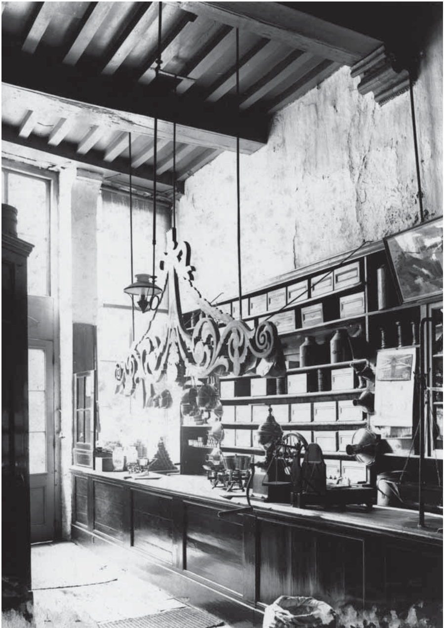
Winkelinterieur grutterij omstreeks 1904.