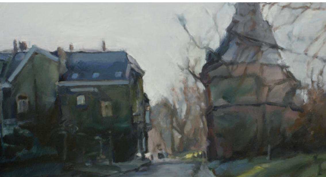
Martin-Jan van Santen. Koud (Cellebroederspoort gezien vanaf de Ebbingestraat). Olieverf op paneel, 45 x 25 cm. 2010.

maakt hij er foto's van, die de opgedane indrukken aanvullen en tevens als geheugensteuntje dienen. Deze registraties werkt hij uit in zijn atelier. De landschappen en stadsgezichten vormen het meest bescheiden onderdeel van het oeuvre, maar zijn daarom niet minder belangrijk. Voor een schilder die de nadruk legt op schoonheid, romantiek en sfeer bieden zijn woonplaats Kampen en nabije omgeving genoeg aanknopingspunten. Van Santen houdt van wolkenluchten, maar ook van oude bouwvallige muren, al dan niet met begroeiing, en helemaal als hij ze op kan nemen in het geliefde evenwichtsspel van licht en schaduw. Met die onmiskenbare voorkeuren weet hij bekende en onbekende Kamper locaties vrijwel altijd in een nieuw licht te zetten.