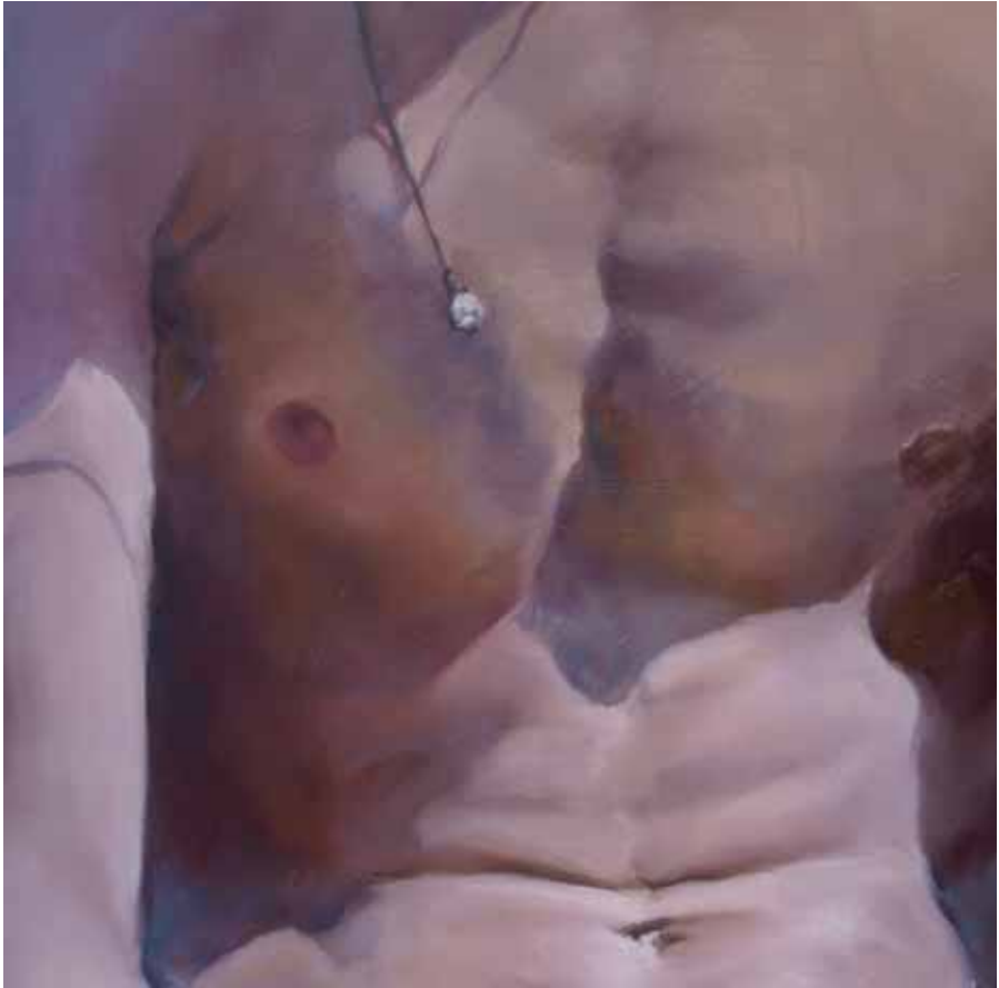
Martin-Jan van Santen. Vakantie. Olieverf op doek, 60 x 60 cm. 2010.

Op basis van een foto kun je veel geconcentreerder schilderen. Een beetje schilder kan in 3-D denken en kijken, en ik heb toch een geheugen! Bovendien heb ik al snel een indruk door een essentieel kenmerk van een gezicht te pakken.' De in het animatiefilmvak opgedane ervaring en het verkregen vermogen om in kort bestek een kernachtige persoonsbeschrijving te maken of een karakter neer te zetten helpen hem bij het uitvoeren van zijn portretten. 'Maar het moet geen karikatuur zijn, ik wil niet dat het lollig wordt.' Het schilderen van mannen blijkt hem gemakkelijker af te gaan dan het schilderen van vrouwen.