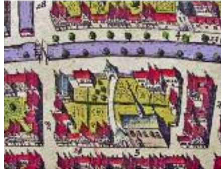
Het Bovengasthuis op de plaats van huize Margaretha met groene ruimte, twee poortjes en een kapel. Kaart van Blaeu.

burgers werd zelfs rijk en invloedrijk. In de stad werd aandacht besteed aan gezondheid en welzijn. Voor alleenstaande kinderen kwamen er weeshuizen, voor zieken ziekenhuizen, voor bejaarden bejaardenhuizen, voor gasten gasthuizen.