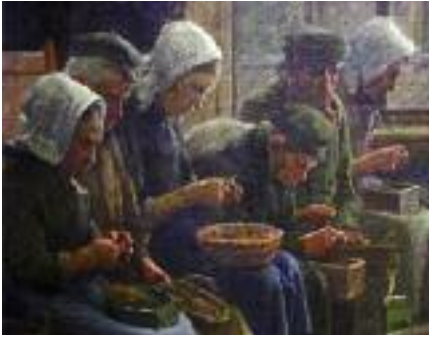
Detail van een schilderij van J.H. de Cock uit het bezit van de Verenigde Gasthuizen, nu in het Stedelijk Museum Kampen.

de moderne tijd: de bouw van een modern verpleeghuis Myosotis.