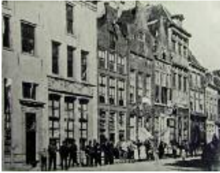
Het Heilige Geestgasthuis. Op de plaats van het witte gebouw staat nu de banketbakkerszaak in Jugendstil en direct er naast is de Gasthuisstraat aangelegd.