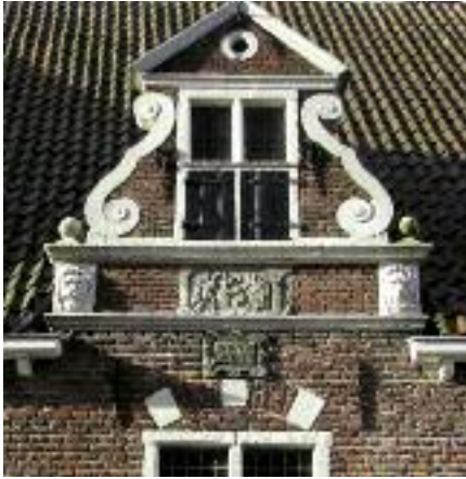
Topgevel van de Bethlehemvergadering.

benoemd, waaraan zij verantwoording van hun beheer moesten afleggen. Zij kregen geen vergoeding. De dagelijkse gang van zaken was in handen van een Vader en een Moeder, een echtpaar zonder kinderen. Veel speelruimte hadden de vader en moeder niet, zeker niet als het ging om het uitgeven van geld. Er was slechts een handjevol personeel.