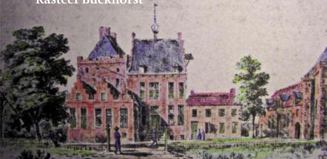
Het kasteel kort voor de afbraak in 1841.