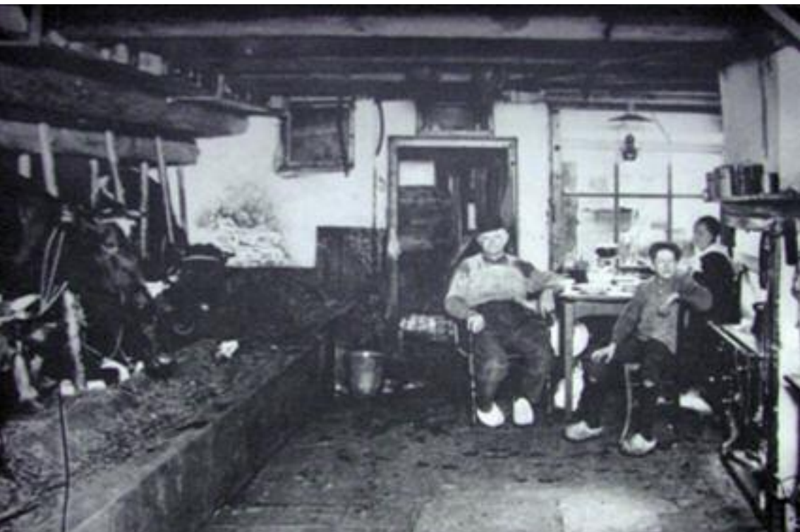
Primitieve leefomstandigheden. Collectie Frans Walkate Archief.

bedrijven kwamen ook de volksgezondheid niet ten goede. Duizenden kubieke meters mest vervuilden de bodem en het grondwater. Een ander groot nadeel van het gemeenschappelijke weidebezit was de systematische uitputting van deze gronden. In plaats van de weilanden te bemesten laadden de Kamper koeboeren de opgehoopte stalmest in schuiten om het te verkopen als hoognodige aanvulling op hun karig inkomen.