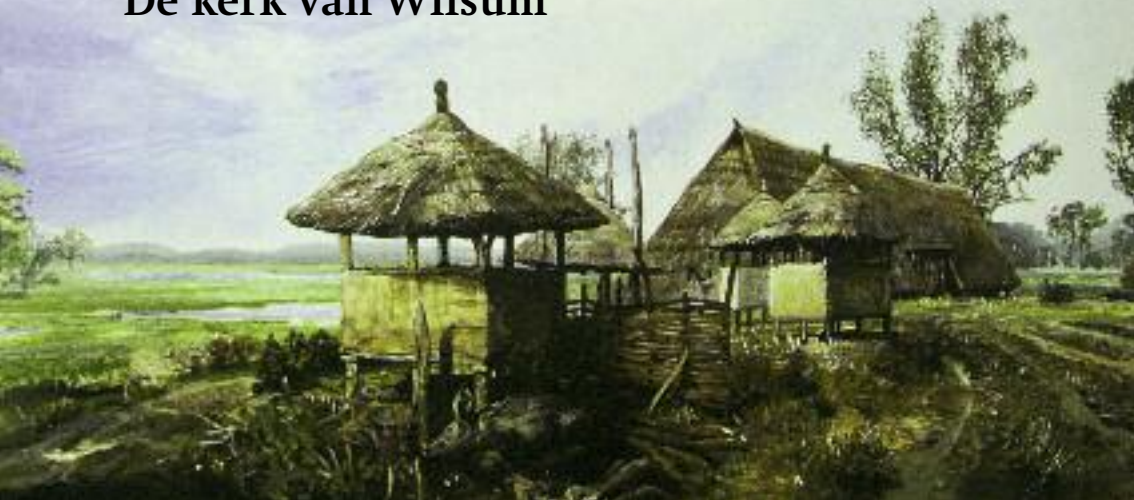
Eerste bewoning op hoge plaatsen langs de rivier.