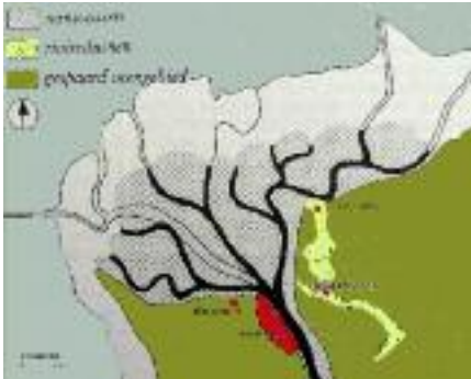
De IJsseldelta omstreeks 1400 naar dr ir P.J.Ente.

Een klimaatsverbetering luidde het einde van de ijstijd in. Het ijspakket dat half Nederland bedekte, begon te smelten. Als gevolg daarvan steeg de zeespiegel, maar die was nog altijd ca. 20 meter lager dan het huidige peil. De Noordzee, die tijdens de ijstijd grotendeels drooggefallen was, stroomde vanaf ca. 6000 voor Chr. weer vol en zeewater drong ons land binnen. Op het grootste deel van het landschap had de wind toen weinig greep meer. In centraal-Nederland ontstond een meren- en dichtbegroeid moerasgebied, omringd door veengebieden.