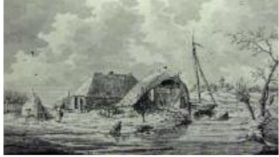
Op de hooggelegen Zandberg in Ijsselmuiden is een Schokker vissersschuit gestrand. Tekening van Dirk Boele 1825 in Gemeentelijk Archief Kampen.

min of meer droog. Alle inwoners behielden het leven, maar het verlies aan vee bedroeg 24 stuks. Een relatief klein aantal, doordat de stadsboeren zo verstandig waren geweest 500 tot 600 stuks vee in veiligheid te stellen in de Boven- en Buitenkerk.