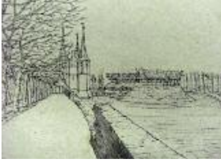
Een deel van de westelijke stadsmuur weggeslagen door de golven. Voor de Broederpoort is het ravelijn als extra verdediging nog aanwezig. Schets naar Dirk Boele 1825. Gemeentelijk Archief Kampen.