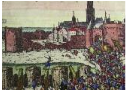
De muur was niet tegen kanonnen bestand.

Kampen kon nu bogen op het trotse bezit van een indrukwekkende stadsmuur die duidelijk maakte dat er met de stad niet te spotten viel. De muur vormde een garantie voor de zelfstandigheid van de stad. Maar al snel bleek deze verdediging niet meer afdoende. Kanonnen en ander geschut werden beter en zwaarder. Vóór de muur aan de landzijde werd in 1543 een nieuwe gracht aangelegd. Hoe nodig aanpassingen aan de muur waren, bleek wel tijdens de Tachtigjarige Oorlog, toen in 1578 de stad door de staatse troepen van Rennenberg werd belegerd. Een kroniekschrijver tekende op: ‘Dese Stadt hadde des maels eenen schoonen