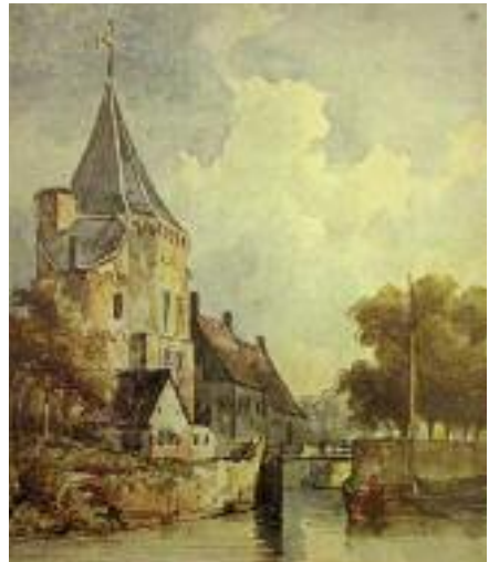
Aquarel Hagenpoort.

Ondertussen bleef de stad groeien. In het noorden ontstond de Nieuwe Hagen. In het westen werden huizen gebouwd op de vóór de Burgel gelegen Vloeddijk. Om de bevolkingsaanwas op te vangen werd in 1462 besloten het gebied tussen Vloeddijk en een daarachterliggende wetering binnen de stad te trekken en te ommuren. De nieuwe muur bood een indrukwekkend aanzien. Hij was ruim 6 meter hoog en bijna 2 meter dik. Behalve dertien muurtorens waren er vijf grote toegangspoorten: In het Zuiden de Venepoort; in het