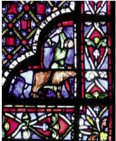
Het gebrandschilderde raam in de kathedraal van Bourges, voorbeeld van een schenking door een gilde zoals dat ook in Kampen het geval kan zijn geweest.

waren muren en gewelven ook beschilderd. Ook het gebrandschilderde glas van de hoge ramen droeg bij aan de kleurrijke uitstraling van de kerk. Nog kort vóór de Reformatie schonk Philips II de kerk zo'n raam. Telde de kerk in 1400 naast het hoofdaltaar zeven altaren, in 1570 waren het er maar liefst 23. Na de Beeldenstorm van 1580 bleef er van die opsmuk weinig meer over. Maar aan de allure van de kerk doet dat niets af. Wanneer de zonnestralen door de grote heldere ramen schijnen, komt het lijnenspel van de gotische bouw nog altijd schitterend tot uiting. Dan toont zich het meesterwerk van de gebroeders Steenbicker en Rutger van Keulen in zijn pure vorm.