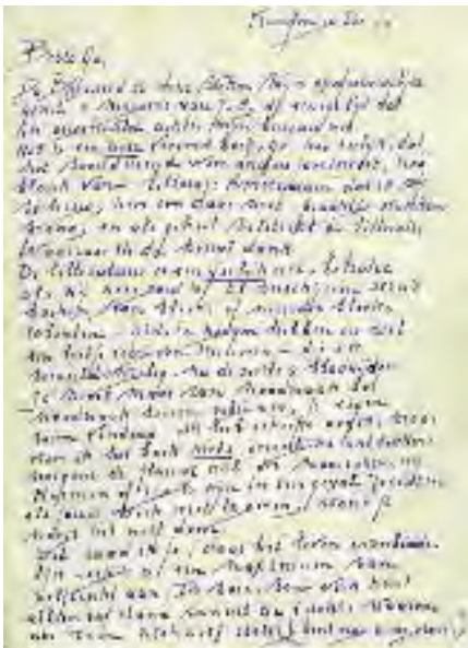
Gerhardts bericht van 19 december 1950.

Het is een zeer vreemd boek, Gé. Zoo eerlijk, dat het voortdurend weer anders fascineert, zo blank van 'litterair Amsterdam' dat ik mij verheug,