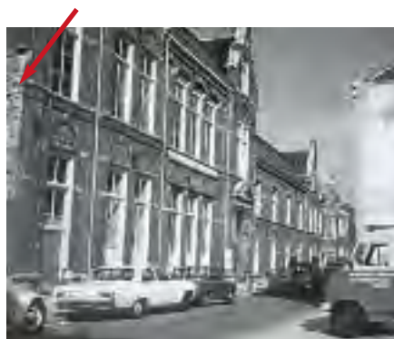
Afb. 3. Het uit 1897 daterende hoofdgebouw van het Bovengasthuis aan de Boven Nieuwstraat met links (bij het pijltje) de zuidmuur waarin de dichtgezette spitsbogen.

bouw van het nieuwe hoofdgebouw, heeft de toenmalige stadsarchitect Bondam in 1861 dit gebouw opgemeten. Op zijn in het Kamper gemeentearchief bewaard gebleven tekening zijn de bogen met middenzuil duidelijk te herkennen (afb. 2) 2 . En het dunnere muurwerk ter plaatse duidt er op dat de bogen eerst later - na de sloop van de kapel? - zijn dichtgezet. Ook aan de afwijkende steensoort is dit af te leiden.