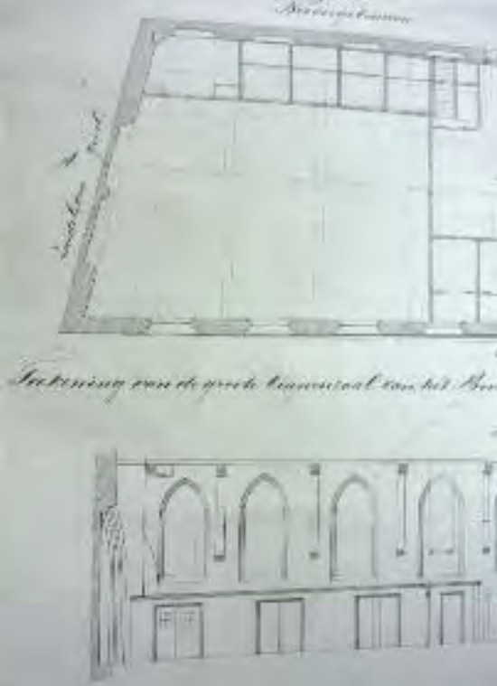
Afb. 2. Detail van de opmeting uit 1861 door P. Bondam, van de ziekenzaal van het Bovengasthuis. In plattegrond en doorsnede de muur met de spitsbogen.