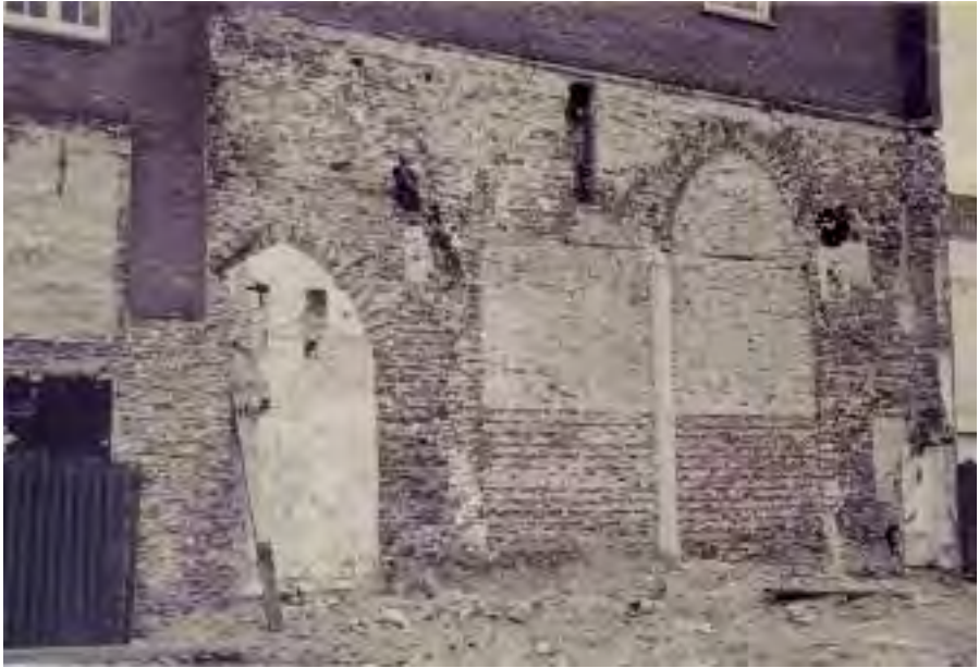
Afb. 1. De tijdens de sloop van de keuken in 1970 vrijgekomen zijmuur met dichtgezette spitsbogen.