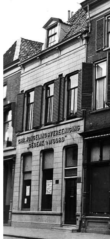
Oudestraat 17 in 1937.

Uit een artikel in het Kamper Nieuwsblad van 18 oktober 1979 ter ere van het honderdjarig jubileum blijkt dat men jaren voor dit doel had gespaard en