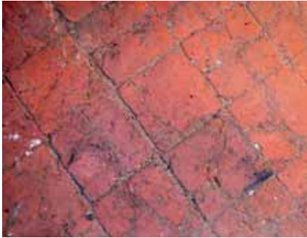
Tegelvloer van rode plavuizen die werd aangetroffen onder de bestaande vloer op de begane grond.