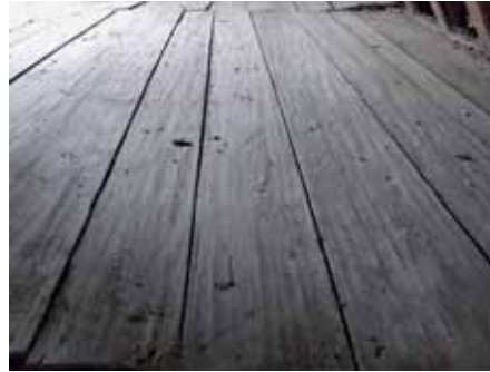
Gedisselde vloerdelen.

Ongeveer 55 centimeter onder de begane grondvloer ligt een gedeelte van een vloer van rode plavuizen die onder een hoek van 45 graden gelegd zijn. Hieronder zijn geen sporen van oudere vloeren aangetroffen, zodat we kunnen aannemen dat het vloerpeil in eerste aanleg circa 55 centimeter beneden het huidige straatpeil lag.