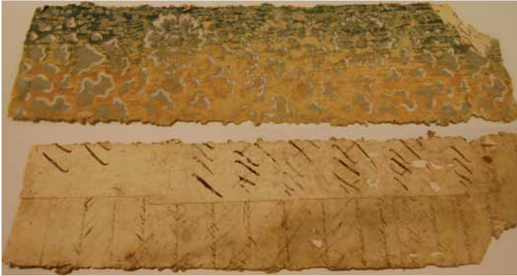
Oude behangdelen en vellen met schrijfoefeningen die als wandbekleding werden aangetroffen.

Ook de ojiefvorm 5 aan de sleutelstukken wordt in deze tijd vaker toegepast. De kap van het pand heeft eiken kromstijlgebinten 6 en eiken gespannen. 7 De gebinten werden vroeger vaak op een andere plaats vervaardigd en samengesteld. Vervolgens haalde men de gebinten weer uit elkaar voor transport. Om de diverse onderdelen op de bouwplaats bij elkaar te zoeken kraste of gutste men er telmerken in. De linkerzijde van het spant kreeg andere telmerken dan de rechterzijde en de telmerken van de spantbenen, de korbelen en de dekbalk kwamen met elkaar overeen. Ook deze kap heeft telmerken, waarvan we aan de volgorde kunnen zien dat de gebinten al een keer zijn verplaatst. De gespannen hebben eveneens telmerken, maar ook deze zijn niet in de oorspronkelijke volgorde aanwezig. Steeds is één eiken spoor van het gespan vervangen door een grenen spoor. Dendrochronologisch onderzoek van de kap heeft geen dateringen opgeleverd. Opvallend aan de kap is de asymmetrische plaatsing op de zoldervloer. Aan de linkerzijde staan de spantbenen ongeveer zestig centimeter uit de muur, terwijl deze aan de rechterzijde in de muur staan. Waarschijnlijk was de oorspronkelijke linker zijmuur zo bouwvallig dat deze ongeveer tachtig centimeter uit het lood stond. Aan het eind van de negentiende eeuw is deze muur vervangen door een nieuwe muur. Deze muur is in de winkel beneden nog