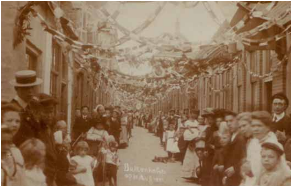
Koninginnedag 1911 in de Hofstraat.

tijden van crisis en soberheid steeds weer de vraag opdook of deze luidruchtige geldbesteding wel op haar plaats was.