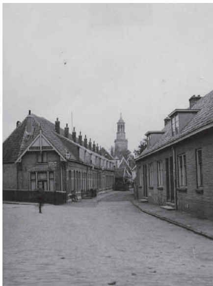
3de Ebbingedwardsstraat, 1937.

bejaardenwoninkjes stond een houten schutting, waarachter zich de tuin van het bejaardentehuis bevond. Op het laatste perceel achter in de Ebbingedwardsstraat was de melkveehouderij van klompenmaker Klaas van Zuthem gevestigd. Ook de Parallelstraat evenwijdig aan de Ebbingestraat was doodlopend, maar toch door een 'eigen weg' verbonden met de Groenestraat.