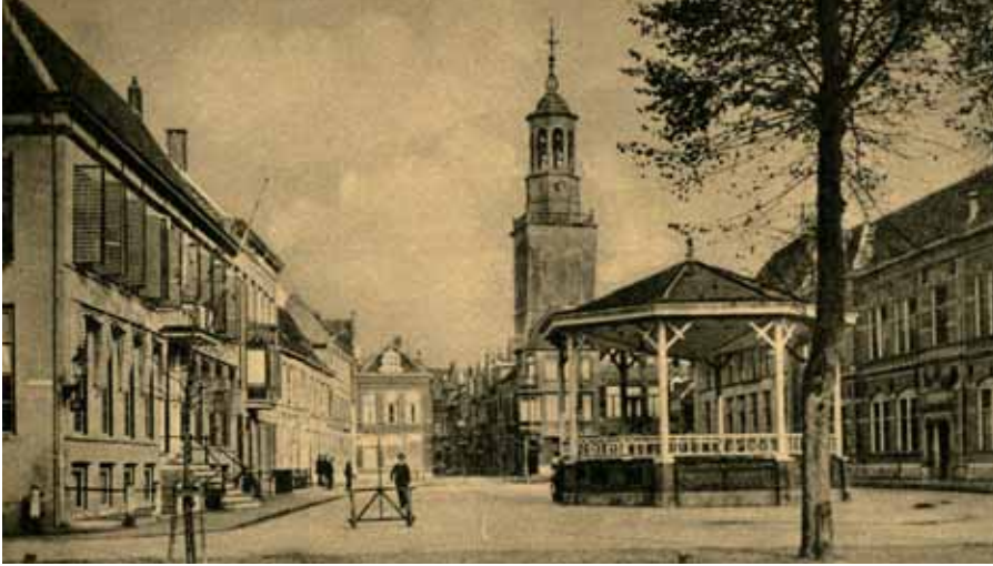
Ansicht van de Nieuwe Markt in de jaren dertig van de vorige eeuw. Links aan het einde het bureau voor Maatschappelijk Hulpbetoon; rechts de gereformeerde MULO (thans onderdeel van de Stadsgehoorzaal).

omschreven, mochten anders eens uitkomen... Aan mij was de taak toebedacht om daarvoor naar de Nieuwe Markt te gaan, en passant, daar ik toch van school kwam (de mulo lag immers aan de Nieuwe Markt). Ik had een verschrikkelijke hekel aan die boodschap, omdat ik bang was door mijn medescholieren te worden gesignaleerd. Als de school uitging slenterde ik met mijn schooltas eerst een straatje om. Maar er was nog een andere reden waarom ik tegen het doen van die boodschap opzag. De ambtenaar achter het loket die de verstrekking uitgaf, Van Putten, mocht mij niet, en dat liet hij blijken ook.