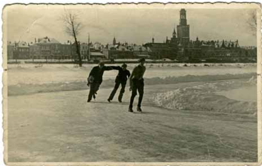
Ap op de schaats in korte broek op 14-jarige leeftijd, met zicht op de stad.

ven tijdens de les over vaderlandse geschiedenis waarover de meester zo mooi en boeiend kon vertellen. Toen de school was uitgegaan gooide ik onderweg naar huis mijn pet met-de-knoop in het drabbige water van de Burgel, dit tot groot verdriet van mijn moeder, die dan weer een nieuwe pet voor mij moest kopen. Toen ik wat groter werd bezocht ik ook de gereformeerde knapenvereniging. Op de jongelingsvereniging liet ik mij wegsturen, maar toen was het intussen al oorlog geworden.