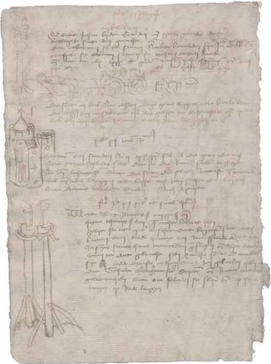
Een pagina uit het Digestum Vetus. De tekeningen slaan respectievelijk op besluiten of vonnissen inzake het naakt op de kaak zetten van mensen die overspel pleegden, het betalen van wagenhuur voor hen die land bezitten in Mastenbroek en voor vergaderingen naar Mastenbroek moeten reizen, het ontruimen van muurtorens omdat er geschut in geplaatst dient te worden, en de terechtstelling op Seveningen van twee moordenaars.