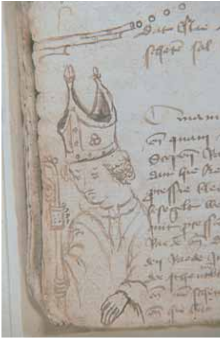
Portret van bisschop David van Bourgondie, bij de beschrijving van zijn inhuldiging in Kampen op 14 oktober 1456. Erboven een geweer, bij een verbod om in openbare gebouwen met vuurwapens te schieten.