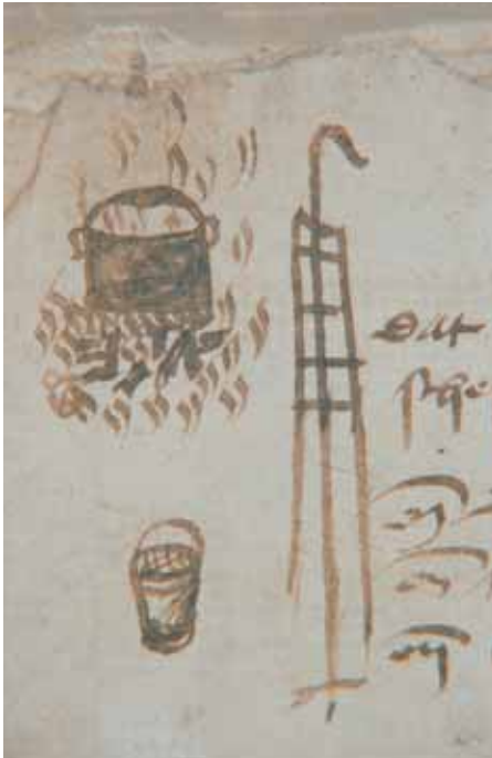
Teerketel, brandhaak en -emmer, afgebeeld in het Digestum Vetus bij een bepaling uit 1457 dat niemand in zijn huis of in schepen pek of teer heet mag maken en dat burgers ter voorkoming van brand water voor het huis hebben staan en brandemmers en haken bij de hand hebben.

ruim 260 tekeningen (bij circa 750 aantekeningen) staan altijd in verband met de tekst, en bij sommige notities staan meerdere illustraties. Vaak gaat het om munten, gereedschap, wapens of andere gebruiksvoorwerpen. Soms zijn er ook mensen of situaties getekend, zoals de nieuwe bisschop en pater Brugman, of een vriend paartje en een man die een jonge vrouw het bordeel inlokt. Daarnaast zijn er afbeeldingen te zien van schepen en wagens en van verschillende soorten dieren. Een aantal keren vormt de tekening een rebus van de hoofdpersoon in een bepaald stuk tekst (bijvoorbeeld een voorn voor de naam Voorne). Bij de vonnissen van misdadigers staan vaak strafwerktuigen afgebeeld.