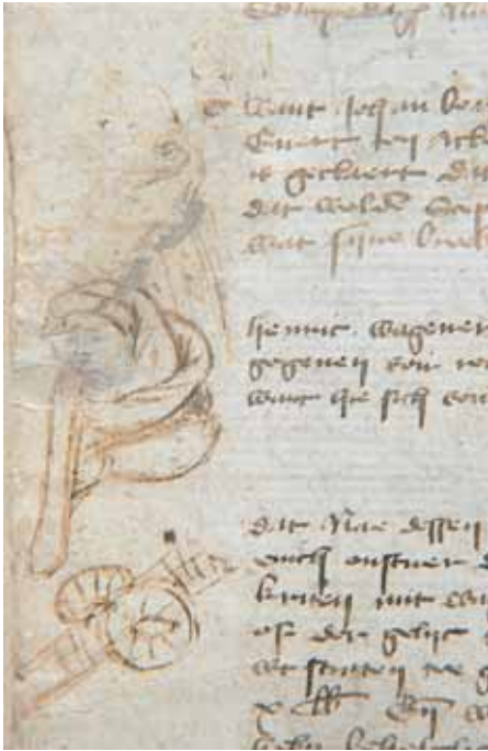
Afbeeldingen uit het Digestum Vetus: afgebeeld zijn geestelijke Henric Wagener (boven) die enige strafbare woorden had gesproken tegen Meester Engbert Wilting (onder). Daaronder een wagen horende bij een verbod om 's avonds o.a. met wagens te slepen.