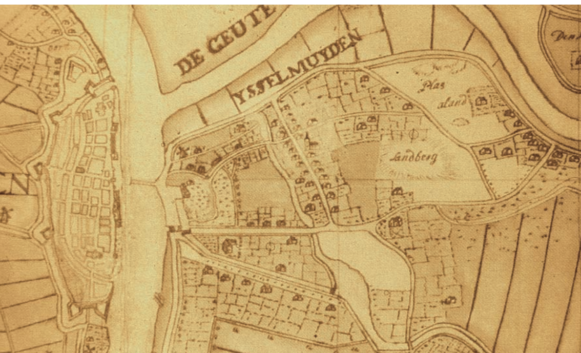
Detailkaart van de vrijheyt der stad Campen door J. Muller uit 1724. Links van de IJssel Kampen, rechts van de rivier IJsselmuiden met geheel rechts de Zandberg. (Collectie: Gemeentearchief Kampen).