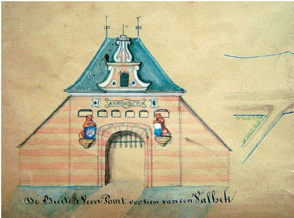
De Buiten-Veenpoort, gezien vanuit de richting Hattem, zoals afgebeeld linksonder op de plattegrond van Hoffman uit 1756.

Voordat een nieuw garnizoen de stad binnentrok, moesten de commandant en zijn officieren eerst een eed van trouw aan de Staten-Generaal, de provincie en de stad afleggen. In Kampen gebeurde de eedsaflegging in aanwezigheid van de troepen ten overstaan van twee vertegenwoordigers van het stadsbestuur buiten de 'Veenpoort', of als men per schip kwam bij de 'Vischpoort'. Het was niet ongewoon om troepen per schip te verplaatsen. In 1783 bijvoorbeeld kwam het nieuwe garnizoen per schip uit 'De Egmond'. De plek bij de Vispoort werd ook gebruikt als het aanwezige garnizoen bij verandering van de politieke machtsverhoudingen een nieuwe eed moest afleggen. Het gebeuren werd vastgelegd in een register van eedsaflegging, vaak met de toevoeging 'Sonder Argelist', dat wil zeggen dat het stadsbestuur de zaak vertrouwde.