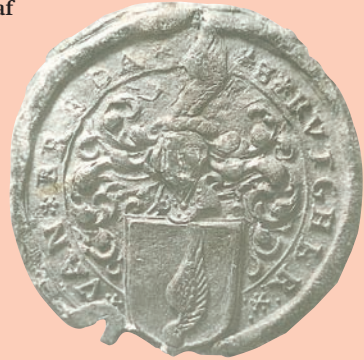
Zegel uit 1603, van raadslid Rutger van Breda