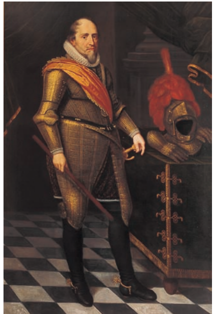
Prins Maurits (1567-1625); een schilderij, in 1625 vervaardigd in het atelier van Michiel Jansz Mierevelt.

Staten-Generaal liet de magistraat op 24 april dan ook een biddag houden 'om Godt den Heere Almachtich van gantser herten te bidden voer die conservatie ende versekertheyt van de staet van 't landt'. Men smeekte dat alle pogingen om de vijand afbreuk te doen, gezegend mochten worden. Alles