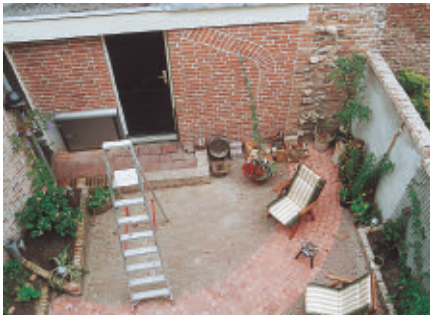
De tuin achter IJsselkade 29 na de werkzaamheden, met in de bestrating aangegeven de aangetroffen fundering van de vroegere muurtoren.