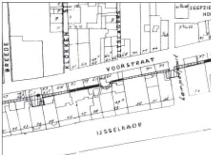
Situatietekening omgeving IJsselkade 27 t/m 29a.