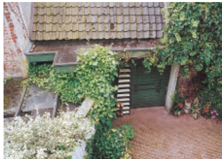
De tuin achter IJsselkade 29 voor de werkzaamheden.