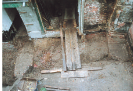
De zuidelijke (links) en noordelijke (rechts) fundering van de muurtoren. In het midden de doorgang via de garage naar de Voorstraat. Rechts daarvan nog een deel van de muur die de muurtoren aan de stadszijde afsloot.