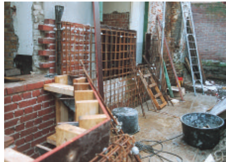
Het aanbrengen van betonijzer voor de waterkerende muur, achter in de tuinen van IJsselkade 27-29a.

Dat betekent dat de muurtoren begint bij de buitenmuur van het gangetje naast onze garage tot aan de tussenmuur tussen no. 29 en 29a. Slechts een heel klein gedeelte valt achter de tussenmuur tussen no. 29 en 28. Dat is praktisch onze hele achtertuin. Ineens is ook duidelijk waarom ter hoogte van onze garage geen stadsmuur aanwezig is, namelijk door de aanwezigheid van deze vroegere muurtoren.