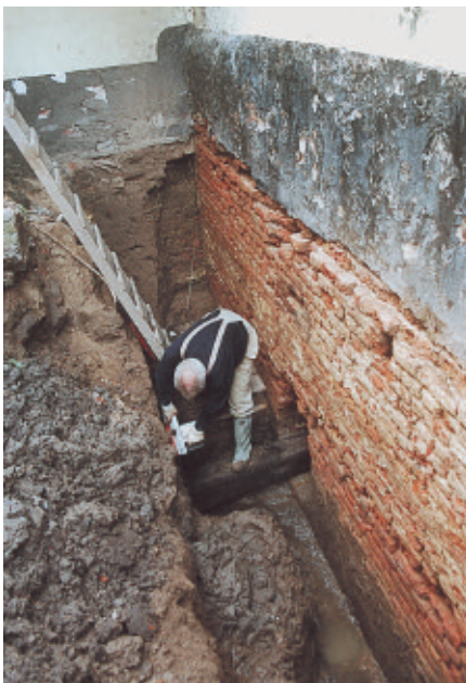
Het verwijderen van de eikenhouten rioolafvoer in de sleuf achter IJsselkade 28.

van de garage afgebroken, evenals de tussenmuren tussen no. 29 en 28 en tussen no. 28 en 27. We hebben nog nooit zo'n brede achtertuin gehad! Vervolgens komt er een mini-graafmachine via de garage onze binnentuin binnen rijden en begint te graven. Een viertal kruiwagenjongens voert de aarde af. Na een kleine veertien dagen ontstaat er een sleuf