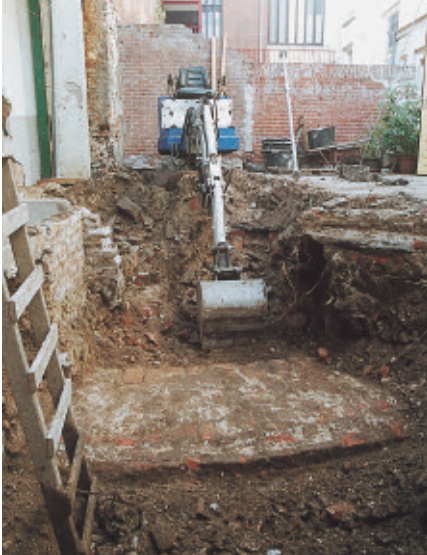
De zuidelijke fundering van de muurtoren wordt door de graafmachine blootgelegd.