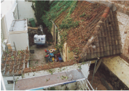
De garnizoenshuisjes achter IJsselkade 27.

getje af naar de woningen no. 27 en 28; recht van overpad. Aan het eind splitst dit gangetje zich weer, zodat de bewoners van deze panden een achteruitgang hebben. Aan het eind van het gangetje naar no. 27 staat een bijzonder bouwwerkje tegen de stadsmuur: twee kleine garnizoenshuisjes. Praktisch op instorten, omdat de huidige eigenaar het wilde afbreken. Monumentenzorg stond