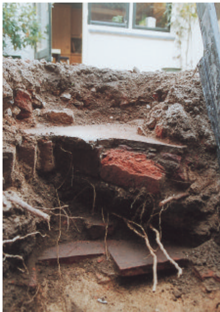
De verschillende aangetroffen vloertjes, met onderop de rode plavuizen.

Toen wij er kwamen wonen, hadden wij het schuurtje weggebroken. En het vloertje eronder ook. Nu blijkt, dat wij niet de eersten zijn die dat hebben gedaan. Wij vinden onder elkaar vier verschillende vloertjes terug, onderling met zo'n 15 cm tussenruimte. Bij de vierde kunnen we niet komen, die ligt te diep. Maar de derde blijkt uit vierkante tegels te bestaan van roodbakkende klei. Afgewisseld met grijze natuurstenen tegels tot een vloerpatroon. Wij kunnen er een stuk of tien redden, schoonmaken en langzaam laten drogen.