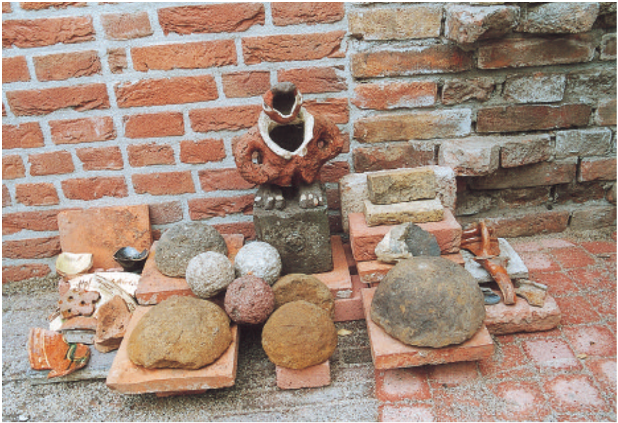
De bij de werkzaamheden gevonden kogels en aardewerkscherven, bewaakt door een zelfgemaakte oppasser.

Een derde vondst zijn de reeds eerder genoemde stenen (halve) kogels in verschillende formaten. Ze waren na het afschieten op de grond gespleten. En natuurlijk de scherven van een hoeveelheid aardewerk, geglaazuurd en versierd. Ze liggen nu als herinnering in onze tuin, opnieuw 'in het rond-eel'!