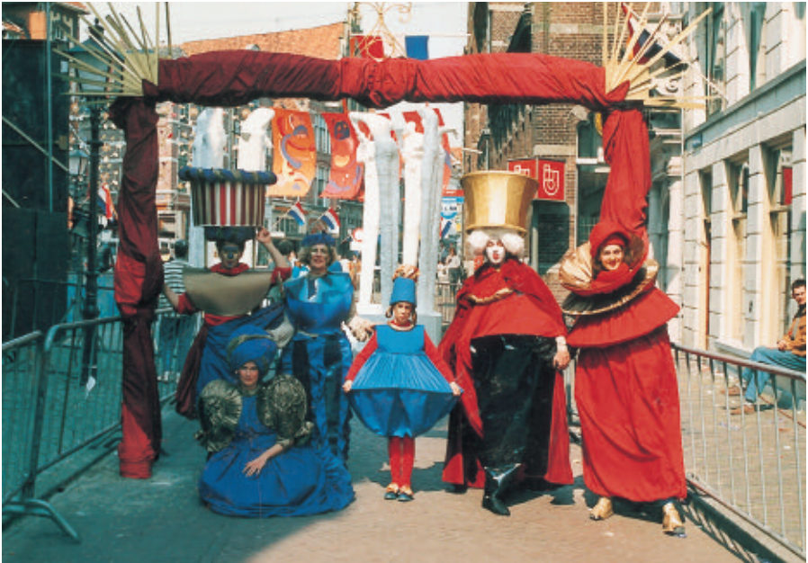
Beatrixontvangstcomité Koninginnedag 1988.

en bestormden bij honderden de smalle wenteltrap tot een zwaar tochtgordijn en een pasjescontroleur tijdelijk de toegang beletten. Daarachter bevond zich een overwegend roodbruine ruimte, met een grote ovalen bar, een podium(-pje), en in één van de torens de toiletten met uitzicht op het park. Achter de bar, veilig in een hoekje, stond de draaitafel, waar gelobbyd werd om de dienstdoende discjockey het ideale swingnummer af te dwingen. Op hoogtijdagen kreunde de houten vloer onder de stampende voeten. Onderdoorgangers hoorden een indrukwekkend, licht beangstigend gebonk, want geluidsisolatie was er niet. Door de kieren tussen de planken