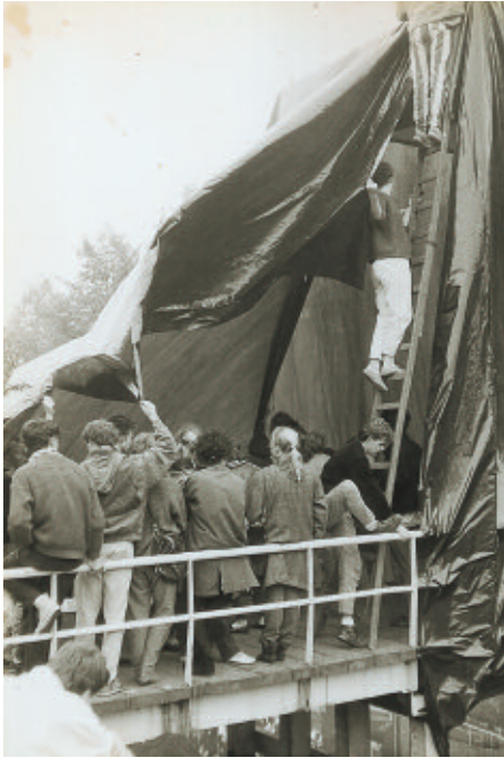
Het inpakken van de Kalverhekkenbrug