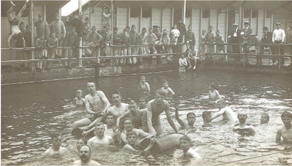
Het tweede drijvende bad bij de Bovenhaven in gebruik door (waarschijnlijk) pupillen en instructeurs van het Instructie-Bataljon.