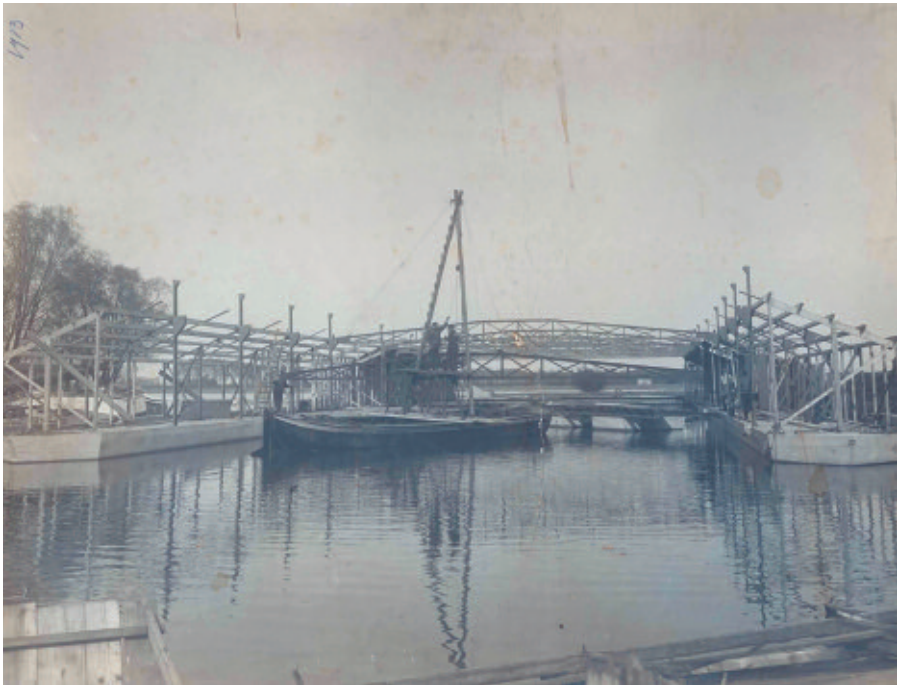
Het tweede drijvende bad in aanbouw, 1913.

Door de bouw van een strekdam bij het station is de ligplaats aldaar sedert 1907 niet meer beschikbaar. In 1908 ligt het bad daarom bij het Oorgat, maar dat is een slechte plek in verband met de lozing van rioolwater bovengstrooms. Het kleine particuliere bad, aangeduid als rivierbad, ligt daar ook. De directeur adviseert om het bad achter de militaire manege bij de Bovenhaven af te meren. Er moet toestemming aan het ministerie van Oorlog worden gevraagd om over het terrein van de manege het zwembad te bereiken. In 1909 laat het ministerie weten geen bezwaar te hebben om op de voorgestelde plek het gemeentelijke zwembad af te meren. Op 28 april 1910 verleent de minister van Waterstaat de formele toestemming om het zwembad op de voorgestelde plaats af te meren. Het bad mag er slechts liggen van 1 april tot 15 november. Buiten die periode wordt het afgemeerd in de Bovenhaven.