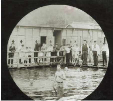
Het drijvende bad tegenover de Zwolseweg, met op de achtergrond de bomen langs de Zwolseweg. De twee volwassen mannen rechts zijn mogelijk de badmeesters.