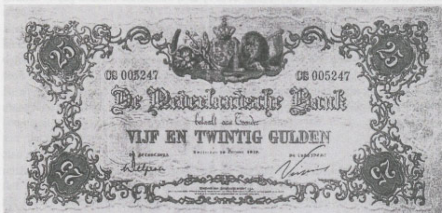
Geeltje. Biljet van f 25,-, vanwege de gele kleur geeltje genoemd

In de 60-er jaren werden de banken meer actief op het gebied van het betalingsverkeer. Het loonzakje ging tot het verleden behoren. Wat lange tijd ondenkbaar was geweest, iedere burger een bankrekening, werd werkelijkheid. Hierdoor veranderden de geldstromen. Contant betalen werd teruggedrongen en het girale verkeer nam steeds grotere vormen aan. Wisselopers, die bijvoorbeeld het geld "aan de deur" kwamen afhalen (nutsbedrijven), behoren nu tot het verleden. De te betalen bedragen worden eenvoudig overgeboekt.