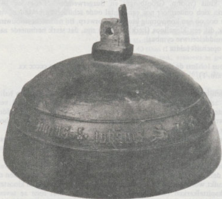
afb. 1. Klokje in de vorm van een halve bol in het bezit van „Het Grootburger- weeshuis” te Kampen.