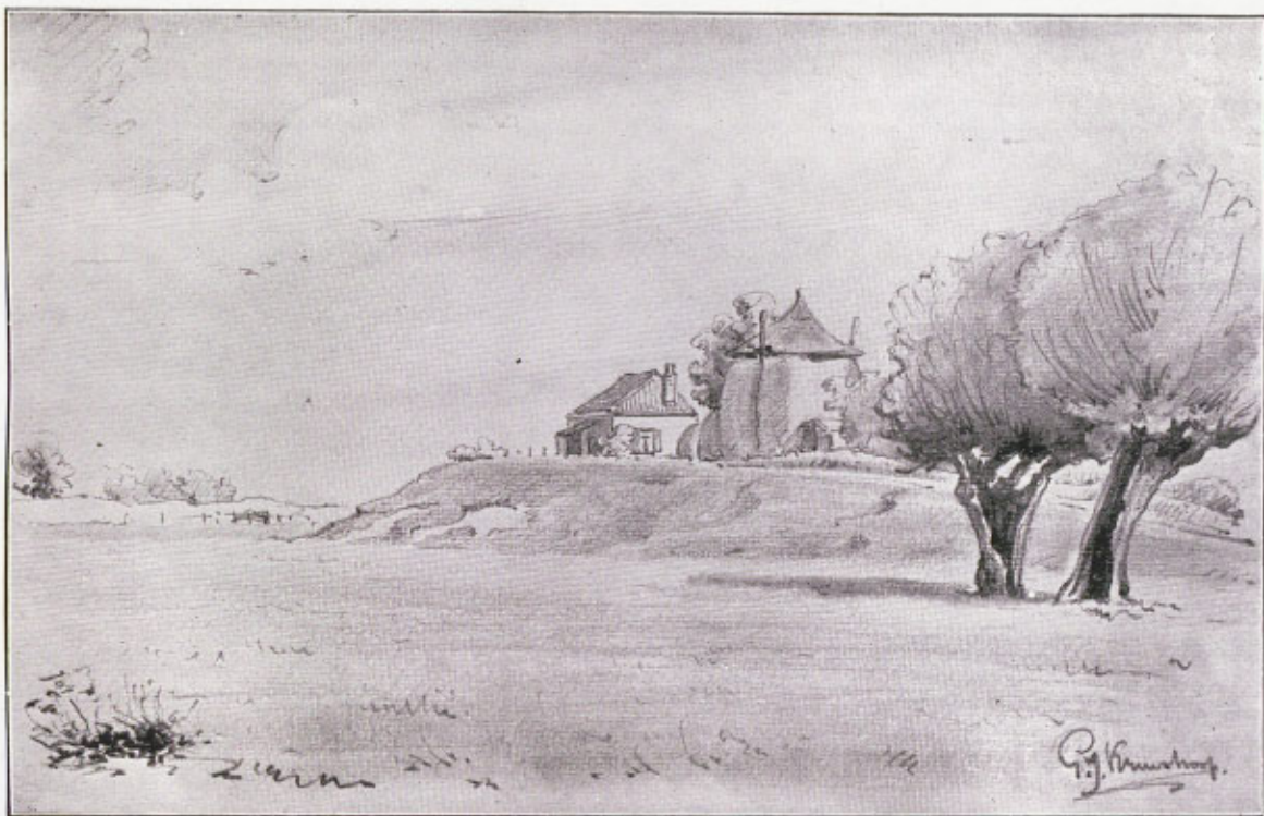
De Zonnenberg te IJsselmuiden.