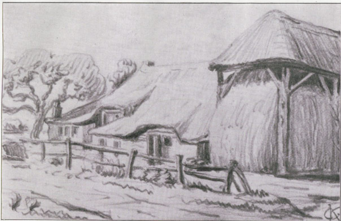
BOERDERIJ AMBT VOLLENHOVE