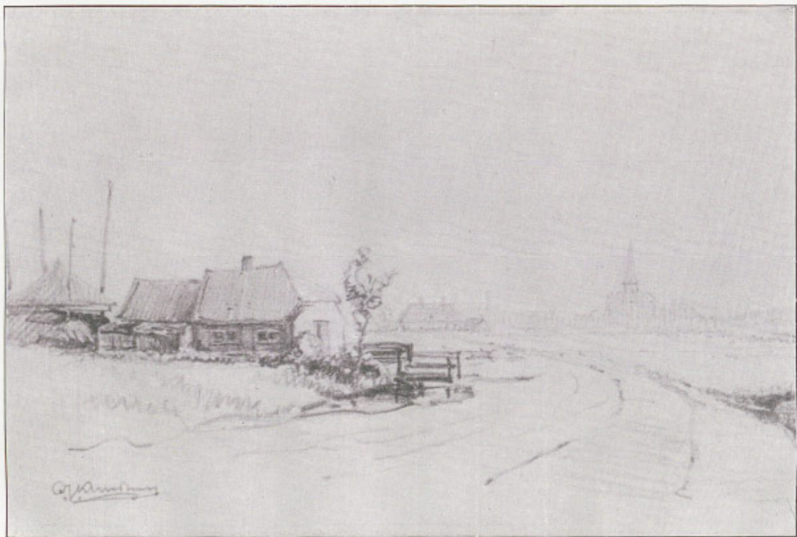
OOSTERHOLTSE STEEG MET GEZICHT OP DE BOVENKERK