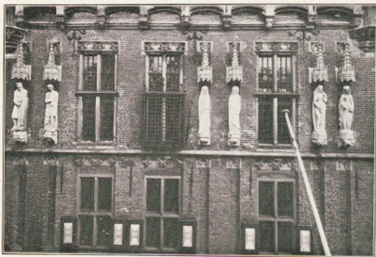
HET LAATSTE VAN DE 6 NIEUWE BEELDEN (3e VAN LINKS), „DE MATIGHEID” VAN J. POLET IS OP 13 OCT. '38 OP ZIJN PLAATS GEZET.