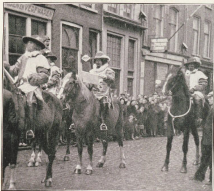
31 JAN. 1938. DE VOORZITTER VAN DE ORANJE-VEREEN, VERGEZELD VAN HERAUTEN, KONDIGT DE BURGERIJ VAN KAMPEN AAN, DAT PRINSES BEATRIX GEBOREN IS.