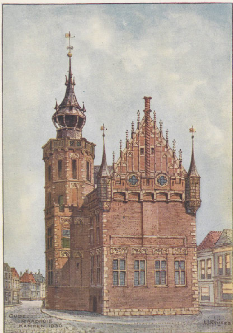
OUDE RAADHUIS KAMPEN 1936