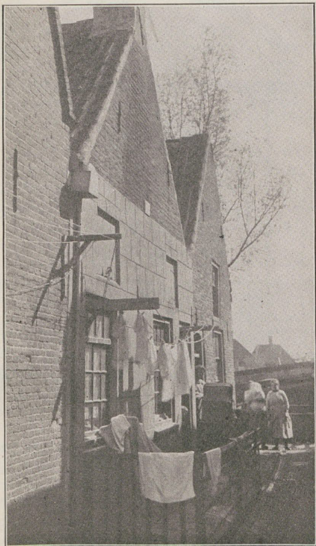
EEN DER STEEGJES IN DE SCHOKKERSBUURT