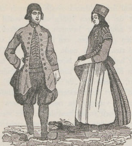
SCHOKLANDERS IN 1840.