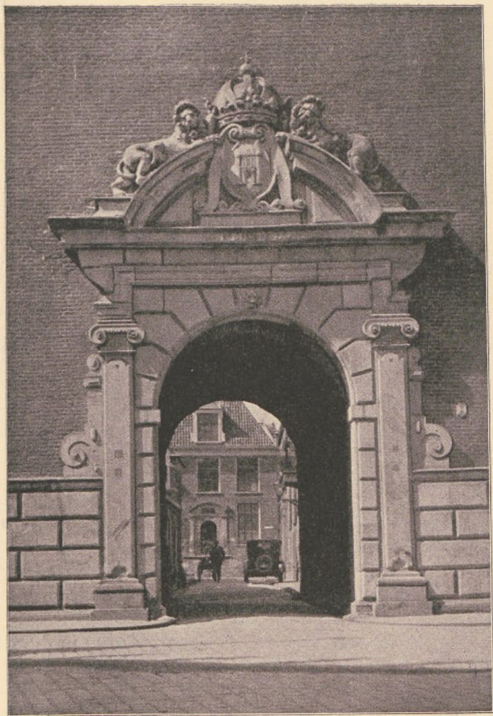
— LAAT RENAISSANCE DOORGANGSPOORT VAN DE NIEUWE TOREN TE KAMPEN DOOR DEN ARCHITECT PHILIP VINGBOONS TE AMSTERDAM PL.M. 1650 ————