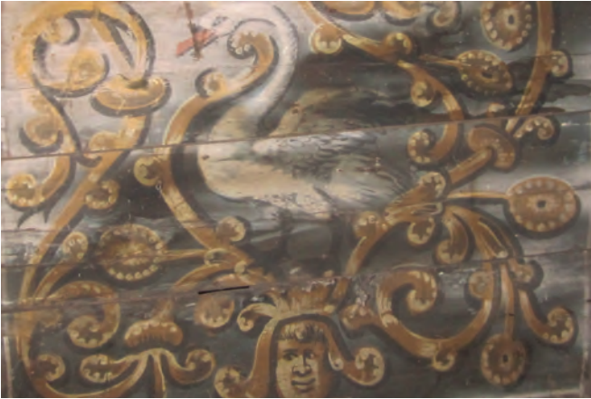
Plafondschildering, detail met zwaan. Afkomstig uit het pand Oudestraat 115. Omstreeks 1540.