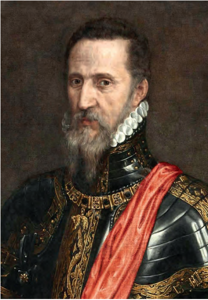
Fernando Alvarez de Toledo, hertog van Alva (1507-1582). Kopie naar Willem Keij, Rijksmuseum Amsterdam (Rijksstudio).