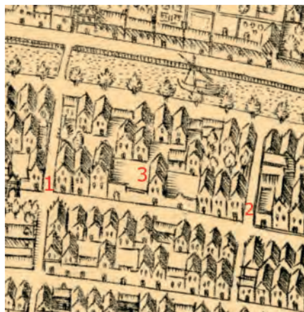
Detail van de plattegrond van Paulus Utenwael. 1 Morrensteeg. 2 Sint-Jacobssteeg. 3 Omgeving van het huis van Joffer Cruse.

koning. Er werd tegen hem gezegd dat volgens de uitgevaardigde plakkatende dan al zijn bezittingen konden worden geconfisqueerd. Volgens een missive van Cancelier en Raden zou men de in Friesland [Groningen] behaalde successen van de hertog vieren op zondag 8 augustus. Op dezelfde dag zouden de voornoemde plakkatende worden afgekondigd. Er moest een lijst worden gemaakt van de bezittingen van allen die in deze landen gevangen zaten of veroordeeld of gevlucht waren omdat zij zich tegen de koning of het katholieke geloof hadden uitgesproken.