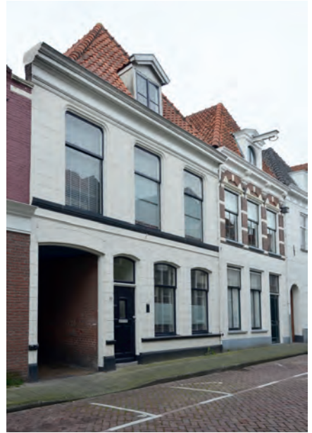
Het huis van Joffer Cruse in de Boven-Nieuwstraat. Hier logeerde Alva.

van Salland, Twente, Vollenhove en IJsselmuiden en gedeputeerden van de steden Deventer, Kampen en Zwolle. Zij konden op tijd in Kampen aanwezig zijn omdat zij in Zwolle bijeengekomen waren om te vergaderen op provinciaal niveau.