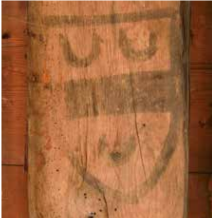
Balk 2, tweede wapenschild van boven.