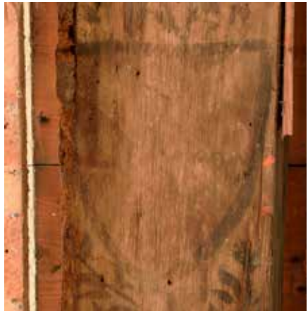
Balk 3, tweede wapenschild van boven.

balken een witte achtergrondkleur is aangebracht die uit gips en een waterig bindmiddel, bijvoorbeeld dierlijke lijm, bestaat. Wat nu als gips gezien wordt, was aanvankelijk vermoedelijk krijt. Onder invloed van luchtverontreiniging kan krijt zich in de loop der tijd omzetten in gips. Met het blote oog ziet men een licht kleurverschil tussen het onbeschilderde deel van de balk en de vervaagde witte achtergrondkleur.