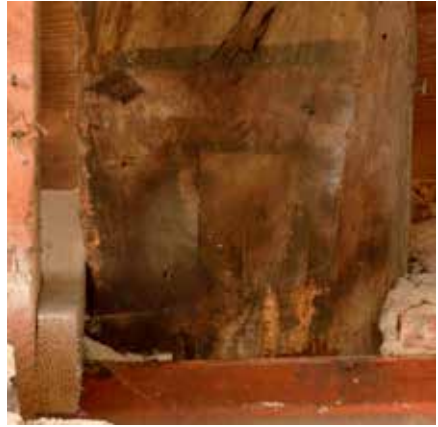
Balk 4, onderste wapenschild.

cirkel. Het is wel opvallend dat men hier net als in Kampen met zwarte biezen of contouren werkte. Een andere beschilderde dennenhouten balklaag van rond 1300 is eveneens in Utrecht aangetroffen, in het pand Oudegracht 175. 26 Een schildering die omstreeks 1976 werd aangetroffen tegen een balkenplafond op de begane grond van Achter Clarenburg 2 te Utrecht werd aanvankelijk gedateerd in het laatste kwart van de 15de eeuw. 27 Dendrochronologisch onderzoek in 1997 dateerde de balken echter op 1380, waardoor de schildering van het fabeldier veel vroeger gedateerd kan worden. 28 Hiermee is deze gefragmenteerde schildering in Utrecht tot nu toe de op een na oudste figuratieve balkenbeschildering van Nederland. Beide voorbeelden tonen aan hoe zeldzaam dit soort geschilderde balken thans zijn in het Nederlandse woonhuis.