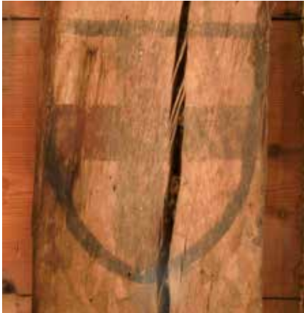
Balk 2, tweede wapenschild van onderen.