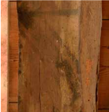
Balk 4, tweede wapenschild van onderen.