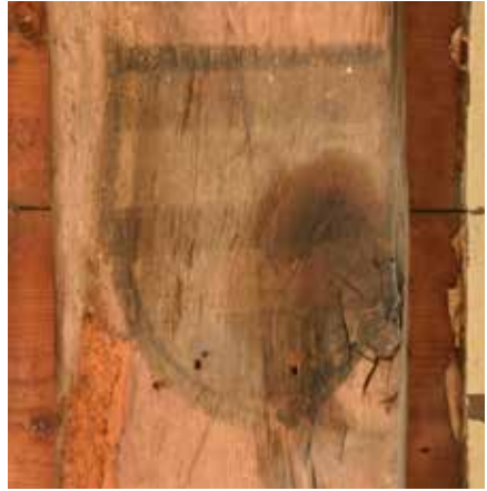
Balk 2, middelste wapenschild.

Hanze behoorden, enkele muurschilderingen uit de eerste helft van de 14de eeuw aan het licht gekomen waarin wapenschilden zijn verwerkt. De rijke burgers wilden zich meer status verschaffen door het uitbeelden van koninklijke of hertogelijke wapens en zelfs gefantaseerde wapens. Aan de tot nu toe aangetroffen wapenseries blijkt geen specifiek heraldisch programma ten grondslag te liggen. De burgers voerden in die tijd nog nauwelijks familiewapens. Vaak werden wapens uitgebeeld van vorstendommen met wie men belangrijke betrekkingen onderhield. 19