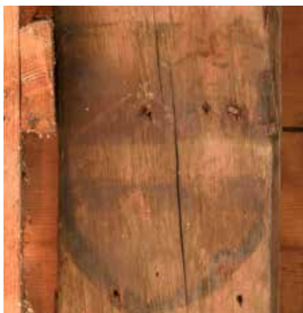
Balk 2, bovenste wapenschild.