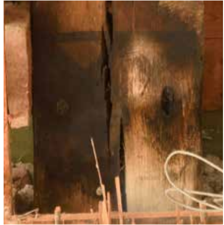
Balk 2, onderste wapenschild.

dendrochronologisch gedateerd op 1478. 20 Uit microscopisch onderzoek naar de verflaagopbouw van de grenen delen blijkt dat hier zes stadia zijn te onderscheiden. 21 De vierde laag betreft een blauwe kleur, waarin het pigment Berlijns blauw is verwerkt. Hiervan is bekend dat deze sinds 1724 wordt toegepast. De drie voorgaande afwerklagen dateren dus van voor die tijd. De oudste laag is een bruine of wagenschotkleur, waarvan bekend is dat die veel in de 17de eeuw werd toegepast. 22 De tweede laag is groenachtig en de derde crèmekleurig. Na de verflaag met het Berlijns blauw volgen nog twee lagen. Eerst een gelige laag en ten slotte een witte waarin zinkwit is verwerkt. Van zinkwit is bekend dat dit pas na 1854 werd gebruikt. 23