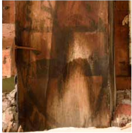
Balk 3, onderste wapenschild.