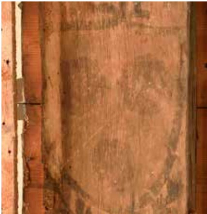
Balk 3, bovenste wapenschild.