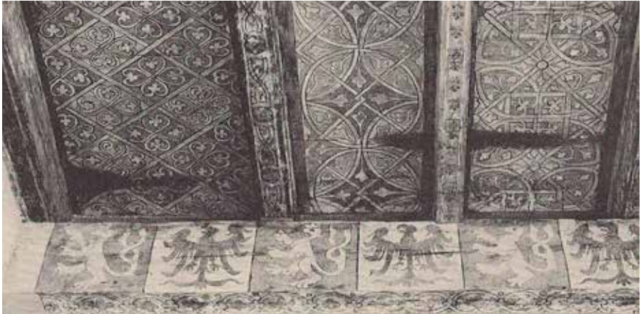
Plafond uit aus zum fau, ca. 1348 opstelling in Schnüttgen Museum te Keulen. Uit Vogts 1966, p.223, afb. 144.

geval - staande leeuwen met dubbele staarten afgewisseld door de rijksadelaar. 14 Op een ander plafond, uit Haus Glesch, Hohe Straße 77-79, dat later is ondergebracht in het Historisches Archiv van de stad Keulen, worden velden met leeuwen afgewisseld met wapenschilden. Hans Vogts, van wie deze gegevens afkomstig zijn, dateerde dit plafond, net als de muurschilderingen in Haus Glesch, rond 1380. Hieruit concludeerde hij dat men toen gedurende lange tijd aan bepaalde decoratiemotieven vasthield. 15 Ondanks de mogelijk jongere datum van ontstaan van de schilderingen in Haus Glesch zijn de leeuwen en ook de wapenschilden in dit plafond primitiever weergegeven dan in Haus zum Pfau.