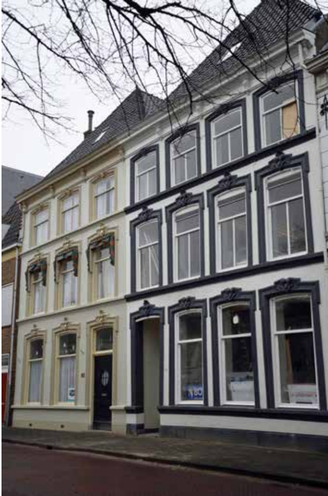
Huidige gevels van Burgwal 80 en 81.