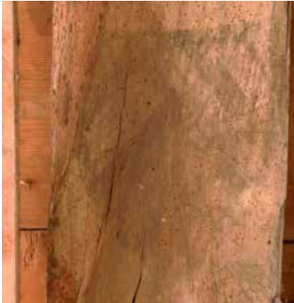
Balk 4, tweede wapenschild van boven.