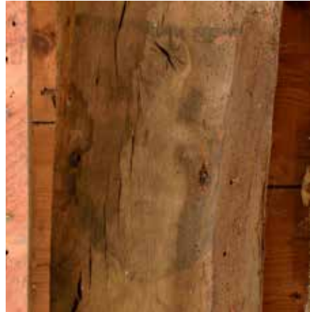
Balk 4, middelste wapenschild.

zich heeft afgezet op de balklaag. De proteïne duidt op een waterig bindmiddel met waarschijnlijk een dierlijke lijm erin.