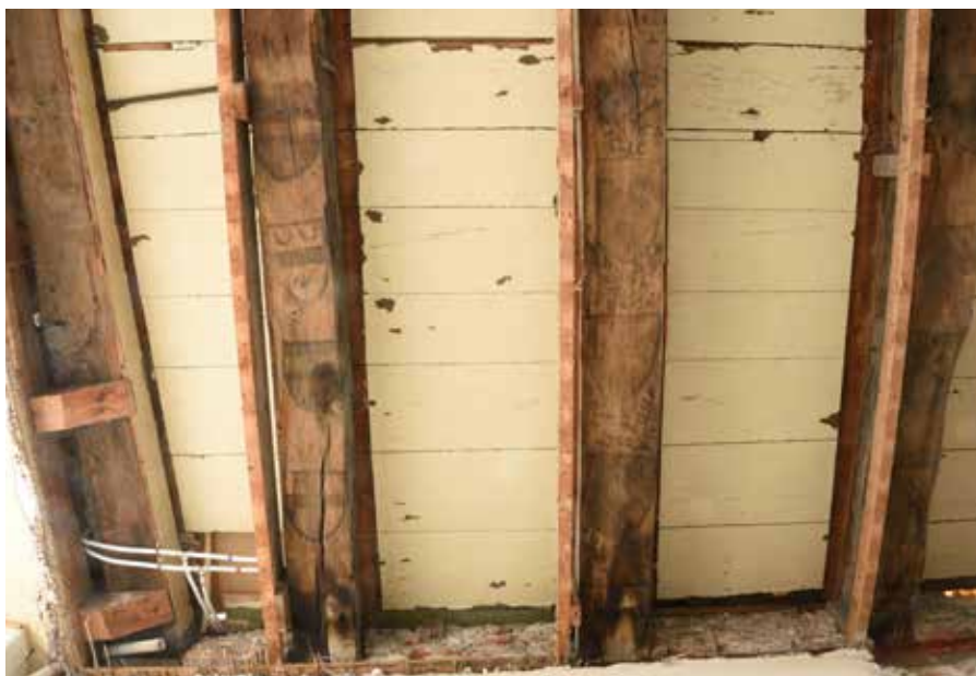
Overzicht van de drie beschilderde balken.

In het pand Burgwal 80 is een jaar geleden de tot nu oudste decoratieve balkenbeschildering van ons land aangetroffen. Deze kwam te voorschijn achter twee later aangebrachte plafondlagen in de voorkamer van de begane grond. Dendrochronologisch onderzoek dateert de eiken balken in 1344. Kunsthistorisch en materiaaltechnisch onderzoek toont aan dat de schilderijen waarschijnlijk kort daarna zijn aangebracht.