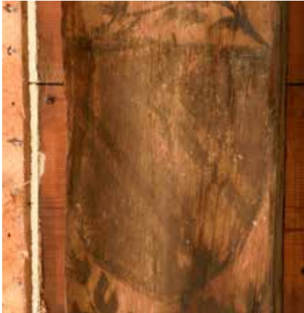
Balk 3, tweede wapenschild van onderen.