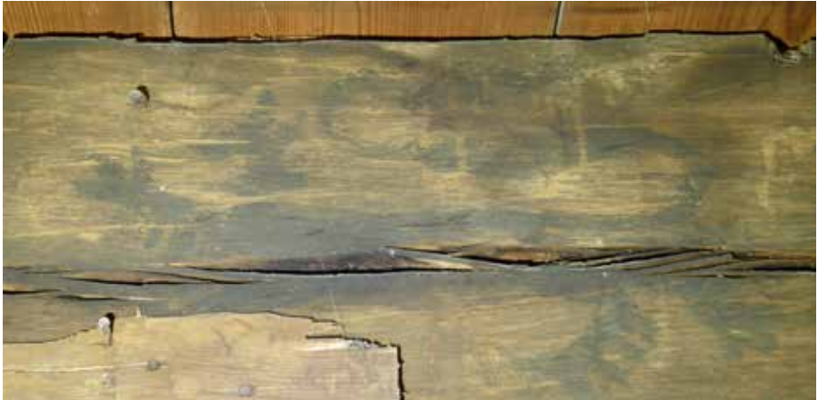
Restant van de gaande leeuw, tegen de rechter zijkant van balk 3.