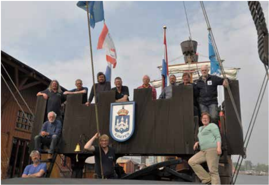
De bemanning van de heenreisgroep in Lübeck.

Brug door. Altijd spannend of dat kan met onze masthoogte van 22 meter. Op de kaart wordt een brughoogte van 22 meter aangegeven. We houden een halve meter over Scheelt zestig kilometer omvaren! Langs Travemünde de rivier de Trave op. Veel mensen op de boulevard zwaaien naar ons. Een draaiorgel speelt het Wilhelmus. Om 18.00 uur op donderdag 19 mei meren we af in Lübeck. We liggen voor hun middeleeuwse replica, de veel grotere Lisa von Lübeck.