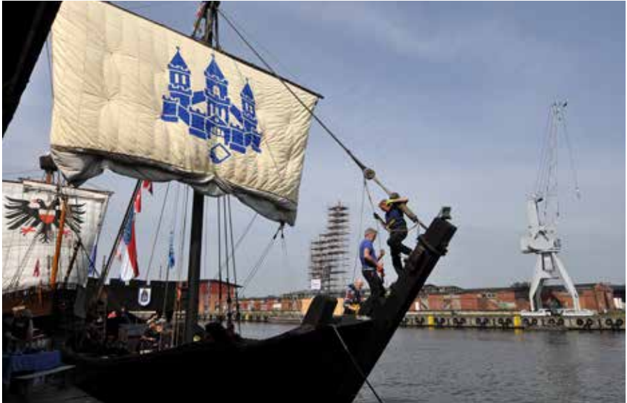
Kamper kogge aan de kade in Lübeck voor de middeleeuwse replica de Lisa von Lübeck tijdens het HanseKulturFestival.

wordt naar de haven van Terschelling te gaan en daar beter weer af te wachten. Helaas, de weersverwachting geeft dagenlang een harde ONO-wind. De Kamper kogge blijft zeven dagen achtereen in de haven van Terschelling! De bemanning vermaakt zich daar prima met een huifkartocht en een bezoek aan de Brandaris, maar baalt enorm van dit lange oponthoud. Een grote teleurstelling! Geen eeuwige roem! Immers, er is geen tijd meer voor een Ommelandvaart. De kogge moet op tijd in Lübeck zijn. Op maandag 16 mei komt de wind eindelijk uit de goede hoek. Een prachtige zeiltocht van Terschelling tot aan het Duitse eiland Langeoog. Nog een hoge deining op zee. Henk krijgt een zwieper van het helmhout met een bloedende hoofdwond tot gevolg. Dan een korte, maar hevige storm voor de Elbe. Drie man zeeziek. Bij Brunsbüttel het Kielerkanaal op. Halverwege overnachten in Rendsburg. Tegen de middag in de sluis van Holtenu. Twee politiemannen aan boord. We hadden ons niet aangemeld toen we van Rendsburg weer het grote kanaal op gingen. Boete 180 euro! Kinderachtig gedoe! Zeilend de Kieler Fjord op. Onderweg drie keer stil gelegen om de vuilwatertankverstopping op te lossen. Lukte steeds gelukkig. Alternatief zou zijn poepen en pissen op de puts! Overnachten in Heiligenhafen. De volgende dag onder de Fehmarn