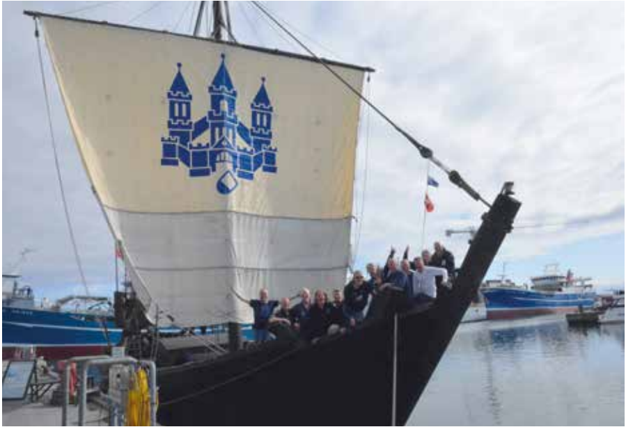
De bemanning van de terugreisgroep in Skagen, een dag voor de historische ronding van Denemarken.

weg naar Skagen! Helaas wind tegen. Na 36 uur stampen tegen de wind in afgemeerd in de industriehaven van Grenaa. Nieuwe motor voor de vuilwartertank geïnstalleerd. Letterlijk een strontvervelend karwei! Vrijdagmorgen om 06.00 uur afgemeerd in Skagen. Veel bezoek met Open Schip. Pers en cameraploegen aan boord. Uitgebreid verslag met foto's in de middagkrant aldaar. De Kamper kogge op Ommelandvaart, dat is voorpaginanieuws! Jan en Johan scoren een partij vis voor een spotprijzje. Zaterdag 28 mei vertrek uit Skagen. Het ongelooflijke gebeurt: na vijf dagen noordenwind is er vandaag een gunstige, meer oostelijke wind! Nog een stukje noordwaarts op de motoren. Het zeil eruit met koers west. En dan een historisch moment: om 13.30 uur passeert de Kamper kogge de meest noordelijke punt en zeilt om het land van Denemarken heen! Gejuich! De grote wit-blaauwe Kamper vlag de lucht in! De ommelandvaart is gelukt! Na 26 uur wordt er zondagmiddag afgemeerd in Thyborøn aan de ingang van de Limfjord. Ontmoeting met Urkers van een vissersboot. Wederom wordt er vis gescoord; ditmaal een kist kabeljauw. Maandagmorgen met een mooie noordenwind zeilend naar Helgoland. Tegen de avond aldaar aan de kade. Het zestig meter hoge rode rotseiland wordt verkend en natuurlijk taxfree drank en tabakswaaren