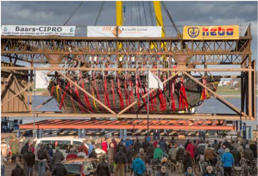
De publieke belangstelling aan de kadde, waar de kogge enkele dagen voor vertrek naar Lelystad werd getoond. Februari 2016.

Op de dijk staat de apparatuur van de verschillende zendgemachtigden. Via internet is een livestream te volgen van de lichterij. Een duizendkoppige menigte verzamelt zich op dijken en kades. Boten en bootjes en zelfs drones cirkelen om het platform heen. Een heel verschil met de aandacht tijdens eerdere activiteiten. Waarmee weer eens wordt aangetoond hoe groot de opzweepende werking van de (sociale) media kan zijn en hoe gemakkelijk een mens te beïnvloeden is. Waar eerst nog sprake was van kogge-scepsis, is die nu omgeslagen in plankenkoorts.