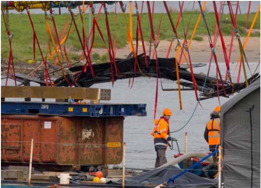
BerGING van de aak. Oktober 2015.

ambitieuze museumopzet pleiten, met ruimte voor alle drie de schepen, mogelijk gefinancierd met behulp van Europese fondsen.