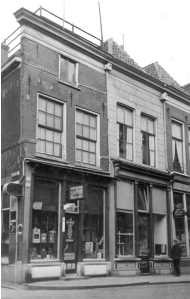
Het pand Oudestraat 130 in de jaren dertig.

ze zich in 1939. In dat pand zetten ze hun verkoop voort, gewoon vanuit de voorkamer. De kinderen weten het nog goed: ‘Vader opende ’s morgens al vroeg de winkel, moeder werkte ons de deur uit en deed haar huishouden. Zodra vader naar de timmerwerkplaats ging, nam zij de winkel over. In de beginjaren konden ze echt niet alleen van de winkel bestaan. Vader begon zelfs in 1940 een begrafenisonderneming.’