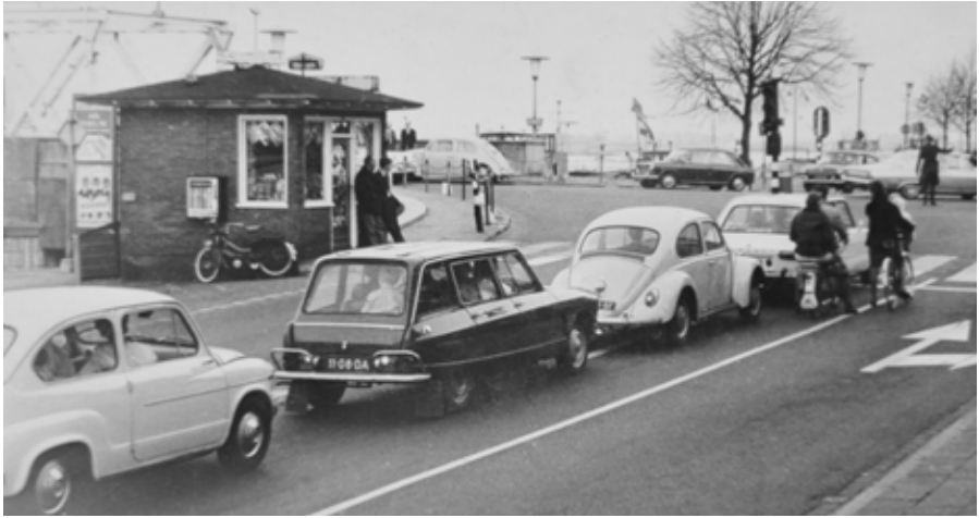
De kiosk aan de IJsselkade bij de Kamper stadsbrug.