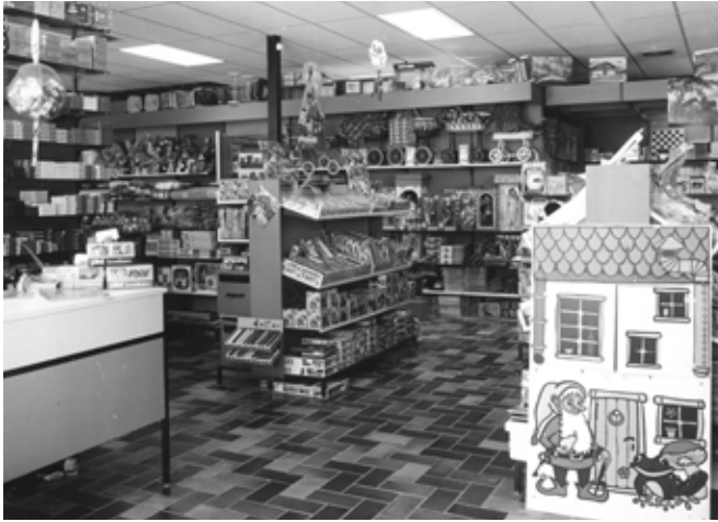
Interieur van de zaak Goosen aan het Penning- kruid (rond 1980).