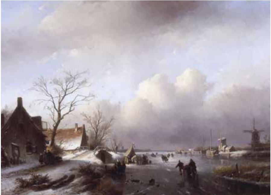
J.J. Spohler. Ijsgezicht. Olieverf op doek. 66 x 91 cm. Circa 1840. Collectie Stedelijk Museum Kampen. Dit schilderij hing mogelijk op de tentoonstelling.

Archief, eveneens gezegend met een aantal interessante werken van de beide broers, levert geen overduidelijke ‘match’ op.