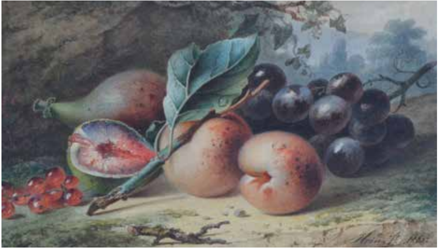
H.J. Hein. Stilleven met diverse vruchten. Aquarel op karton. 1865. 33,5 x 24,5 cm. Collectie SNS Historisch Centrum / Frans Walkate Archief. Een representatief voorbeeld van een stilleven van H.J. Hein.

verkocht dan behield, daar werd op de eerste tentoonstelling een vijfde gedeelte der geëxposeerde schilderijen verkocht. 60 Vervolgens richt hij zich op de inhoud. Hij vindt het aantal historiestukken te klein en is niet tevreden met de gangbare verklaringen dat dat zou komen door de protestantse geest van het land, of door het grote formaat dat historiestukken vereisen en dat niet geschikt zou zijn voor de kleine Nederlandse huizen. Eerder ziet hij de oorzaak in een te geringe ontwikkeling van de kunstenaars, die hun werk al beginnen te verkopen voordat hun opleiding is afgerond. Een algemeen probleem volgens hem. Kunstenaars leggen zich te weinig toe op de esthetische en wetenschappelijke kanten van hun vak en leren niet 'fijn te denken en te voelen'. Dat leidt tot oppervlakkigheid: 'De historieschilder is zijn onderwerp niet meester, bij gebrek aan (inhoudelijke) kennis en de genreschilder wordt smakeloos en onbeduidend, omdat hij den smaak en de fijne opvatting mist.' 61 Vaak beheerst hij wel de techniek, maar lukt het niet het werk een ziel mee te geven, en leidt hij de aandacht af, bijvoorbeeld door opvallend kleurgebruik. 'De kunst gaat verloren, daar zij zich in kunstjes oplost.' Zeker 'wanneer men de manier boven de gedachte stelt'. 62 Dit manco illustreert de schrijver aan de hand van diverse bij name genoemde werken. Herhaaldelijk hamert hij op het belang van het tekenen als essentiële basis voor goede kunst. Een stokpaardje. Door het grondig tekenen van een