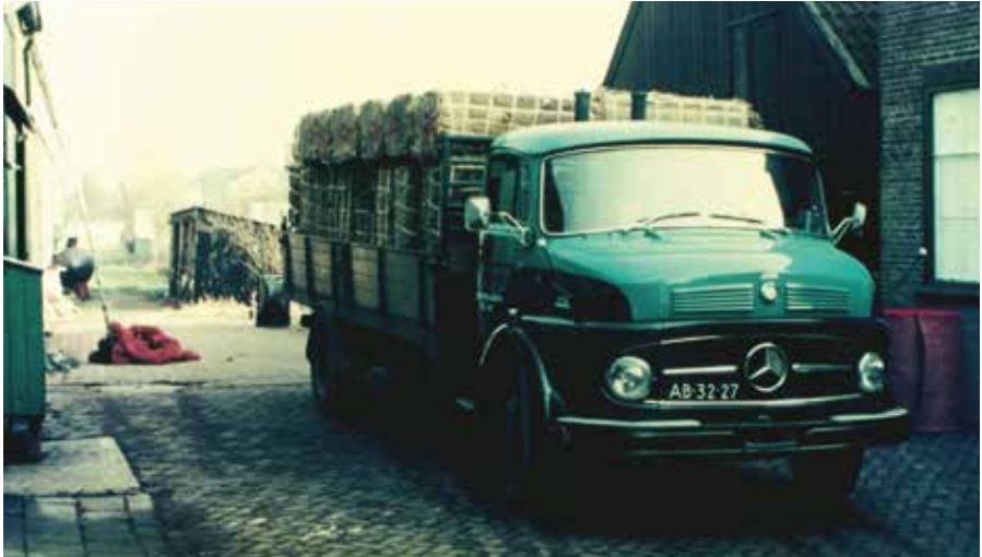
Een vrachtwagen met balen kokos arriveert bij de fabriek (1968). Het kokos wordt in de magazijnruimtes (rechts) opgeslagen. In de fabriek (links) worden de balen geveerd, een baal rood geveerde kokos ligt buiten al klaar. Jan van den Berg begon met zijn tapijtverkoop op de zolderverdieping boven de magazijnruimtes. Dit pand met de grond eromheen is later verkocht, anno 2016 staan er vier woonhuizen. Foto privécollectie.